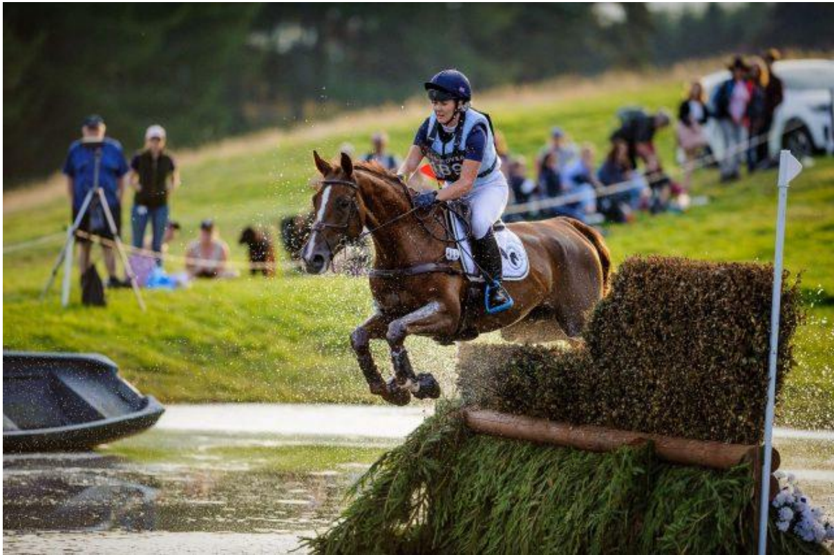
Slika 2. Windrush centar za terapijsko jahanje

svijeta. Danas se u SAD-u može pronaći preko 660 centara, a njihov broj neprestano raste. U razvijenijim državama Europe centri za terapijsko jahanje formirani su u sklopu većih rehabilitacijskih ustanova, koje zatim pomažu manjim rehabilitacijskim centrima (Itković i Boras, 2002).