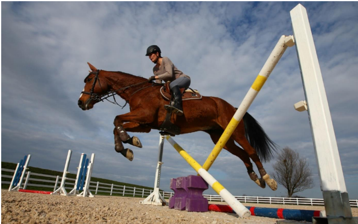
Slika 4. Sportsko jahanje