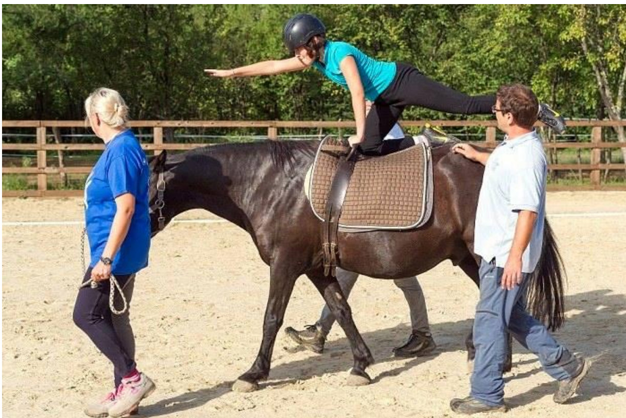
Slika 3. Terapija pomoću konja