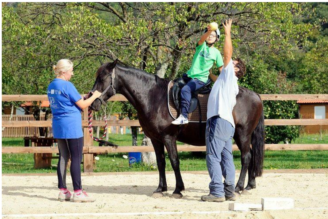
Slika 2. Terapija pomoću konja

uspravnom položaju te da se usmjeravaju kako žele. Razlog tome je trodimenzionalno ljuljanje konjskih leđa kod pokreta konja (gore-dolje; desno-lijevo; naprijed-natrag), a rezultat je rotacija zdjelice i trupa jahača. Kada sjedi na leđima konja, invalid mora neprestano reagirati na pokrete konja, dočaravajući stvarno kretanje, unatoč tome što su mu noge nepokretne. Snagom mišića trupa on se uspravlja protiv sile teže te dobiva osjećaj stabilnog simetričnog položaja tijela. Upravo zbog neprekidnog njihanja ispruženih nogu i mobiliziranja kukova, hipoterapeuti moraju paziti na položaj zdjelice od koje se pokreti usmjeravaju prema trupu i udovima. Istovremeno su angažirani i veliki zglobovi, odnosno ramena i kukovi, stoga je gruba i fina motorika udova olakšana (Itković i Boras, 2002). Šuvak (2004) pak navodi da je za hipoterapiju od velike važnosti da je konj u pokretu dok je jahač na njemu te da se jahanje odvija bez sedla. Zbog takve strategije terapije od jahača se očekuje neprestana suradnja i komunikacija s konjem. Usred hipoterapije dolazi do izoštravanja osjećaja za ravnotežu te svih oblika motorike, dok se pokreti konja prenose na osobu koja se nalazi na leđima konja. Prelazeći na tijelo jahača, ti pokreti invalidima pomažu u opuštanju njihovih mišića te poboljšavaju cirkulaciju.