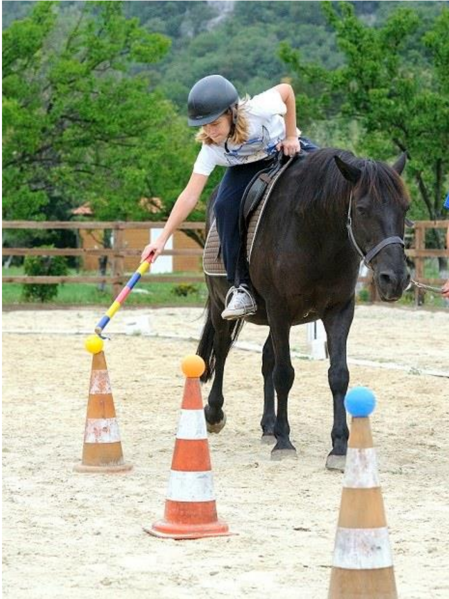
Slika 5. Terapijsko jahanje