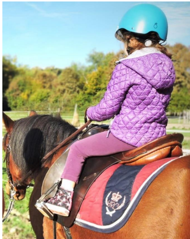
Slika 1. Dijete na konju

Šuvak (2001) objašnjava terapijsko jahanje kao oblik konjaništva koji je namijenjen te prilagođen osobama s posebnim potrebama kako bi se poboljšala kvaliteta njihovog života te postigli razni terapijski ciljevi koje takve aktivnosti mogu ponuditi. Bitni su faktori organizacija, provođenje i nadziranje terapijskog jahanja, a za to je zadužen educirani instruktor jahanja te, po potrebi, određeni medicinski stručnjaci.