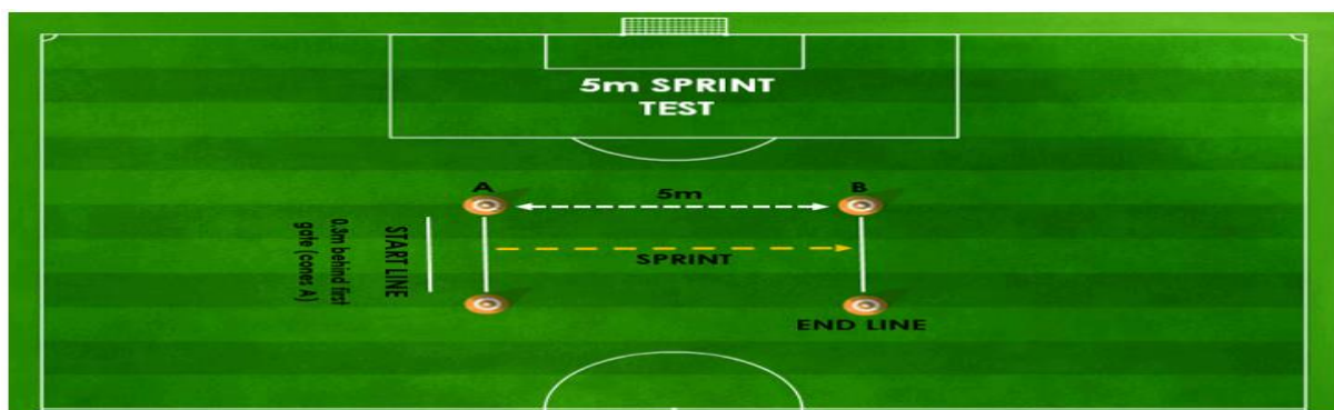
Slika 4. Test na pet metara udaljenosti

Kapica za početak mjerenja brzine na pet metara je postavljena na bijelu liniju te je na udaljenost od pet metara postavljena druga kapica iste boje, udaljenost je izmjerena metrom. Ispitanici su provodili zadatak jedan za drugim abecednim redom. Prvi ispitanik bi stao pored prve kapice na bijeloj liniji te krenuo na znak mjerioca, kada ispitanik krene štoperica se pokreće te ispitanik u što kraćem vremenu pokušava stići do druge kapice. Štoperica bi bila zaustavljena kada ispitanik prođe pored druge kapice, te bi postignuti rezultati bio upisan u tablicu pored ispitanikova imena. Nakon što su svi ispitanici odradili zadatak na pet metara udaljenosti istim redoslijedom su odradili zadatak na 10 i 20 metara (Slika 4-6).