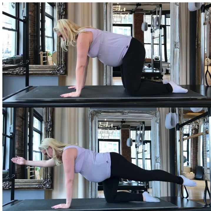
Slika 3. Vježbu „quadruped“