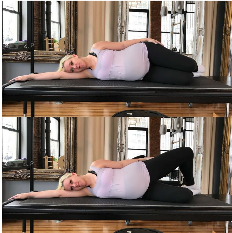
Slika 1. Vježba školjke

pokret. Pokret kreće kada se koljeno odvoji od drugog koljena i nakon toga se vrati u početni položaj. Ponavlja se pokret par puta i mijenja se strana (Slika 1.)