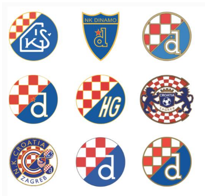
Slika 1: Grbovi kluba kroz povijest