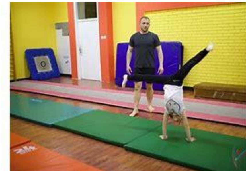
Slika 3. Strunjače za rad na nastavi TZK