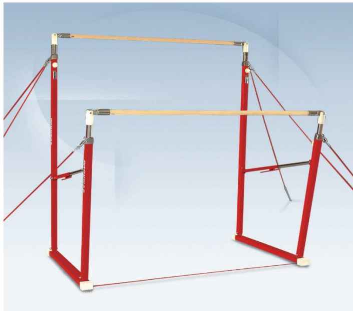
Slika 10. Dvovisinske ruče