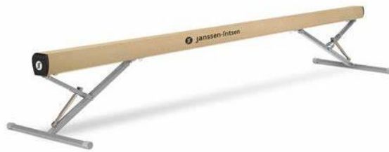
Slika 11. Greda