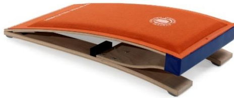
Slika 9. Odskočna daska