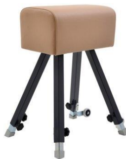
Slika 8. Kozlić