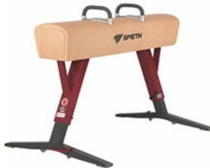
Slika 7. Konj s hvataljkama