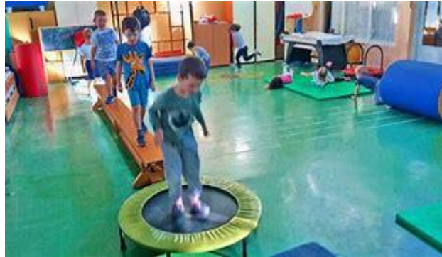
Slika 12. Kružni sat TZK za predškolsku dob

se ispod kozlića i dolazi do debelih strunjača na kojima radi palačinke. Zadnja stanica je mala greda koju prehoda uz pomoć svog odgajatelja i ponovno kreće cijeli krug ispočetka (ponoviti tri puta). Nakon završetka zadnjeg kruga djeca sa svojim odgajateljima odrađuju završni dio sata uz vježbe opuštanja (Gimnastika za djecu, 2021) 11 .