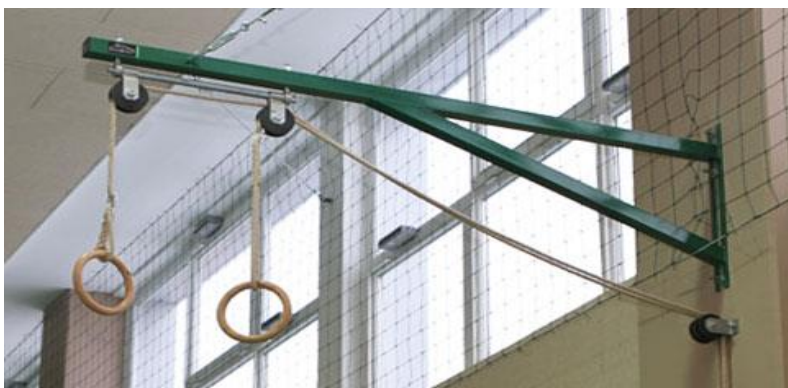
Slika 6. Krugovi