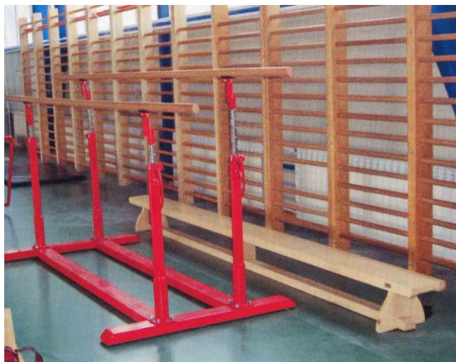
Slika 4. Ruče za muške gimnastičare