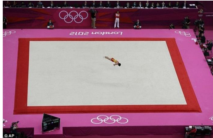
Slika 2. Gimnastički parter