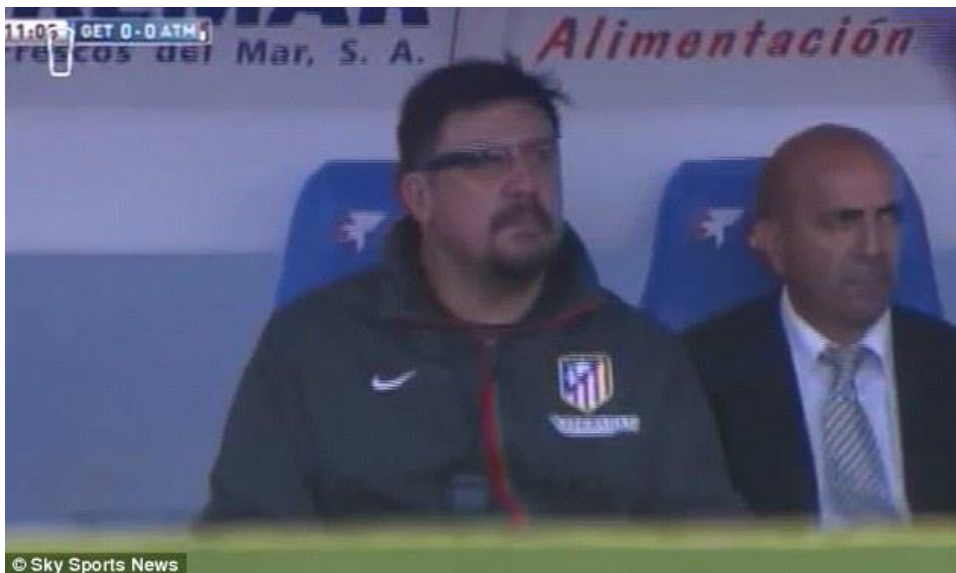
Slika 1. Pomoćni trener Atletico Madrida nosi Apple Glasses koji mu u realnom vremenu pruža statističke podatke o igri svoje ekipe.

U današnjem modernom svijetu kreirani su mnogi računalni programi koji se koriste za notacijsku analizu utakmica (Dartfish, CourtEye) koje pružaju mogućnost analiziranja same utakmice u realnom vremenu ili pomoću videa . Prethodno navedeni programi pružaju podatke o cijeloj ekipi ili jednom igraču korištenjem većeg broja varijabli u većem (ili manjem) broju natjecateljskih ili prijateljskih utakmica . Poželjno je da broj promatranih utakmica bude što veći radi mogućih odstupanja u promatranju i bilježenju podataka kao i odstupanju u kvaliteti izvedbe nogometaša. Dobiveni podaci se promatraju te ih trener koristi u svojim treninzima, sve sa svrhom unaprjeđenja TE-TA znanja nogometaša i upoznavanja nogometaša sa zahtjevima trenera u svim fazama igre.