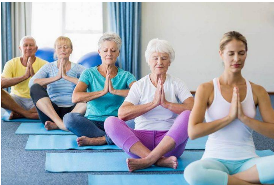
Slika 4 Sat joge