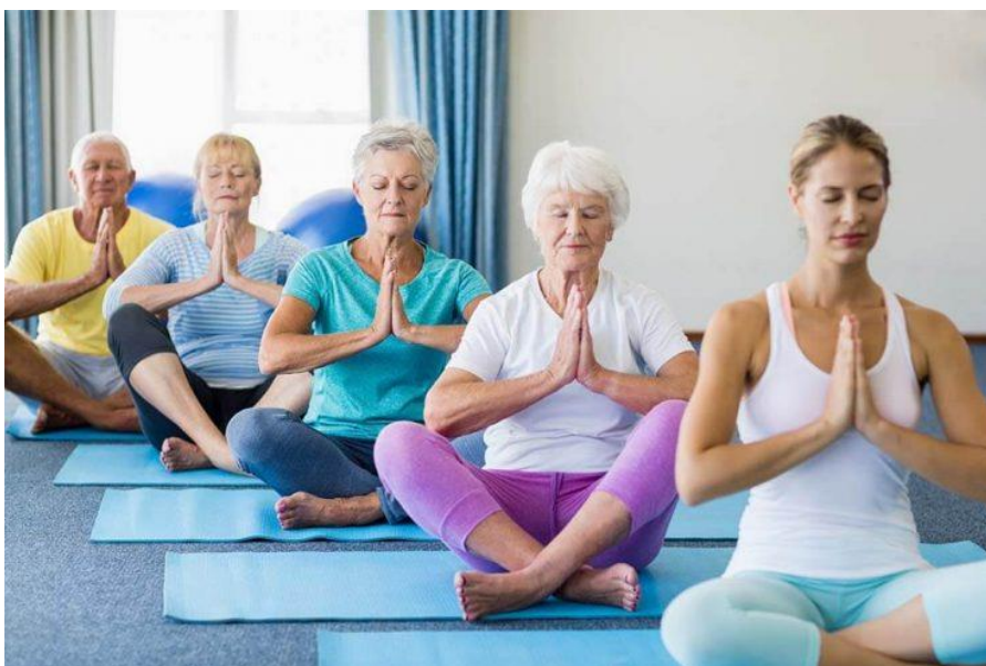
Slika 4 Sat joga