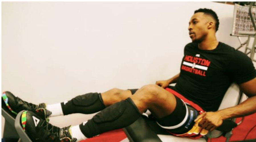
Slika 2. Dwight Howard primjenjuje okluzijski trening

Primjena okluzijskog treninga svoju svakodnevnu svrhu počela je tražiti u najjačoj košarkaškoj ligi. Dwight Howard, tada centar Houston Rocketsa, u suradnji sa klupskim stručnim stožerom i Johnny Owensom uveo je okluzijski trening u svoj standardni plan i program treniranja (Slika 2). S obzirom na veliku duljinu njegovih ekstremiteta i već ozbiljne igračke godine, teški treninzi snage s velikim opterećenjima predstavljali su preveliki napor za njegova koljena i tijelo u cijelosti. Iz toga razloga počeo je vježbati na način da koristi niska opterećenja s ograničavanjem protoka krvi. Uzimajući u obzir specifičnosti pozicije centra te veliki broj skokova tijekom utakmice primjena okluzijskog treninga sačuvala ga je od dodatnih ozljeda i zahvaljujući tome produžio je svoju sportsku karijeru. Iz Howardovog primjera može se zaključiti da okluzijski trening može pomoći sportašima u prevenciji ozljeda i jačanju mišićne mase tijela.