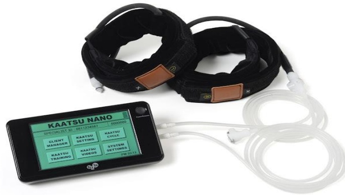
Slika 1. Kaatsu uređaj

treniranom ekstremitetu (Abe, 2006). Samim djelovanjem okluzijskih traka pojavile su se različite nuspojave nakon primjene okluzijskog treninga.