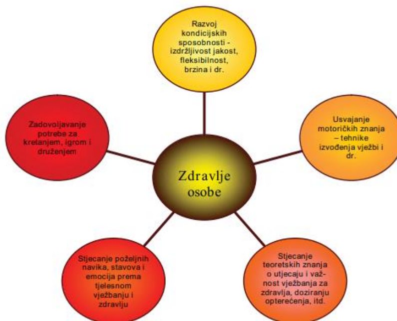
Slika 1. Organizacija želja i ciljeva koji se pokušavaju ostvariti kroz prakticiranje tjelesne aktivnosti

Izvor: Bungić, Barić (2009:67). Tjelesno vježbanje i neki aspekti psihološkog zdravlja. Zagreb: Kineziološki fakultet u Zagrebu