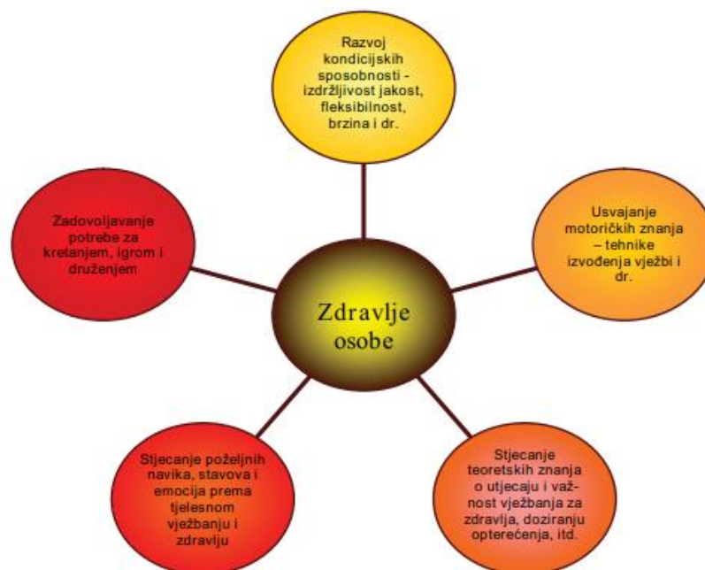
Slika 1. Organizacija želja i ciljeva koji se pokušavaju ostvariti kroz prakticiranje tjelesne aktivnosti

Izvor: Bungić, Barić (2009:67). Tjelesno vježbanje i neki aspekti psihološkog zdravlja. Zagreb: Kineziološki fakultet u Zagrebu