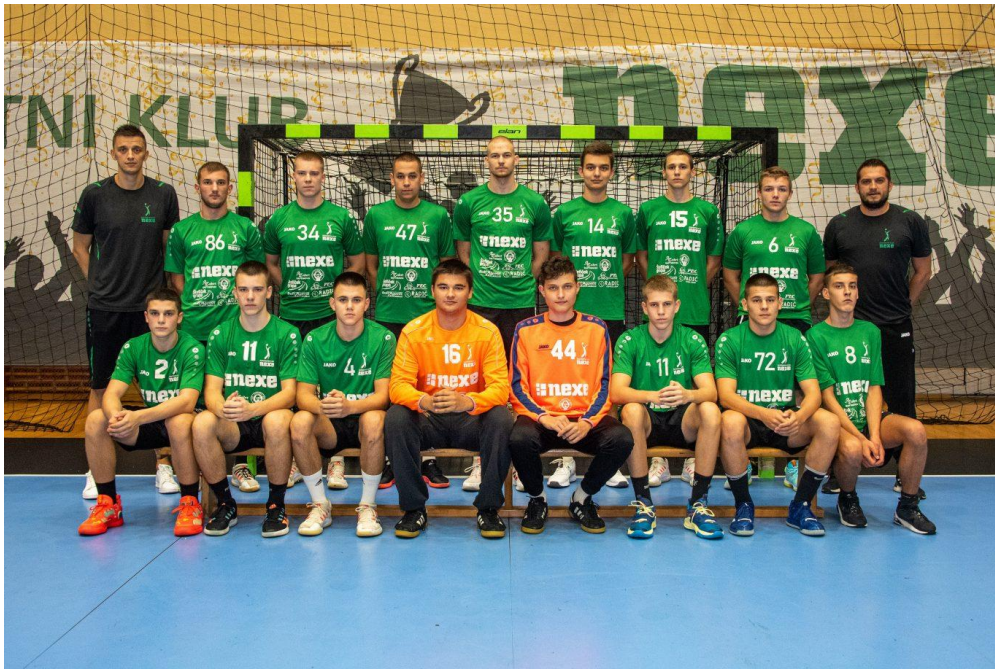
Slika 15. Selekcija U17

U sklopu NEXE akademije, 2021. godine, realiziran je projekt mini škole rukometa koji se provodi u 7 osnovnih škola s preko 400 djece uključenih u sam projekt. U projekt su osim trenera uključeni i nastavnici osnovnih škola. (Jelisavac, Donja Motičina, Podgorač, Orahovica, Feričanci, Đurđenovac, Našice). Sve s ciljem kako bi se djecu potaknulo na druženje i zainteresiralo za rukomet. ( https://shop.rknexe.hr/about-us/nexe-academy/ )