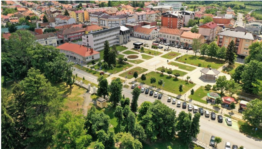
Slika 1. Centar grada Našica

Našice (Slika 1) je mali gradić u srcu Slavonije smješten jugozapadno od Osijeka. Dobitnik je 9 nagrada “Zeleni cvijet” za najuređenije mjesto 5.000 do 10.000 tisuća stanovnika ( https://tznasice.hr/o-gradu/zeleni-cvijet/ ).