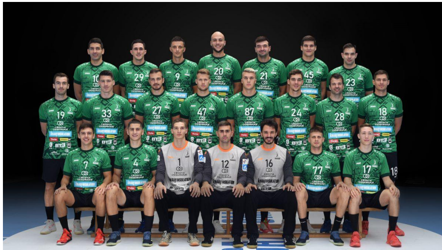
Slika 9. Ekipa seniora u povijesnoj sezoni 2021./22.

gostima je ostalo samo da sačuvaju taj rezultat što i uspijevaju (37:37) te prolaze na Final four. U polufinalu igraju protiv SC Magdeburg, snažne njemačke ekipe, te unatoč velikoj borbi gube 34:29. Utakmicu za treće mjesto također gube no svejedno je ovo ogroman uspjeh za cijeli klub i hrvatski rukomet. ( https://www.eurohandball.com/en/club/2NOqZP4SBNuB3gbULi5nMQ/rk-nexe/ )