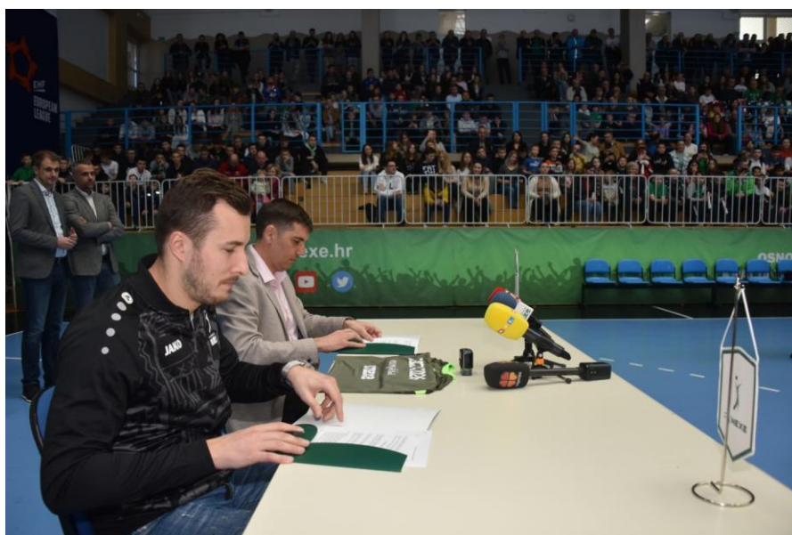
Slika 14. Manuel Štrlek

Manuel Štrlek je istaknuti hrvatski rukometaš, poznat po svojim izvanrednim vještinama i doprinosu hrvatskom rukometu. Štrlek je stekao svjetsku slavu svojom predanošću igri i izvanrednom tehnikom. Njegova sposobnost postizanja golova iz teških pozicija i dinamična igra na terenu čine ga nezaobilaznim igračem u timu. Njegova prisutnost na terenu donosi energiju suigračima i inspiraciju svim ljubiteljima rukometa. U tekućoj sezoni 2023./24. potpisao je za RK NEXE te se smatra jednim od najvećih pojačanja kluba kojem će zasigurno pomoći ka cilju osvajanja prvenstva Hrvatske. Na predstavljanju igrača skupio se velik broj posjetitelja što je dokaz o kakvom se igraču radi. ( https://www.rknexe.hr/news/novi-grom-manuel-strlek )