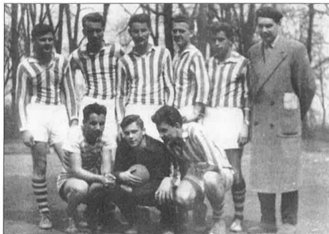
Slika 3. Prva rukometna ekipa u Našicama

Na sjednici Nastavničkog vijeća Gimnazije Našice 26. studenoga 1955. godine predloženo je osnivanje školskog sportskog društva koje bi se trebalo baviti sportom koji do tad nije postojao u Našicama. Predloženo je da to bude rukomet. Tako je školske 1955./56. godine osnovano prvo srednjoškolsko sportsko društvo „Srednjoškolac“ (Slika 3). Ekipa je bila sastavljena od polaznika prva tri razreda našičke gimnazije. S obzirom da nisu imali vlastiti prostor za trening, trenirali su na igralištu u obližnjem Đurđenovcu ili na stadionu NK „Krndija“ sve dok učenici koji su bili učlanjeni u sekciju nisu sami sebi napravili teren. No s obzirom kako su učenici završavali gimnaziju, nisu više mogli biti članovi ŠSD-a. Zbog toga je bilo potrebno osnovati klub ili društvo koje će se baviti razvojem tzv. malih sportova, te je tim povodom 1958. godine osnovan DTO „Partizan“. Godine 1959. kompletna rukometna ekipa ŠSD „Srednjoškolac“ prebačena je u DTO te tako počinje s radom rukometna sekcija u DTO „Partizan“ Našice. S obzirom da je DTO posjedovao dvoranu, treninzi su se mogli odvijati redovito preko cijele godine. (Čalić, 2013.)