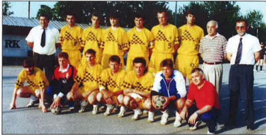
Slika 7. RK „Našice“ , seniori koji su osvojili 3. hrvatsku rukometnu ligu u sezoni 1994./95.