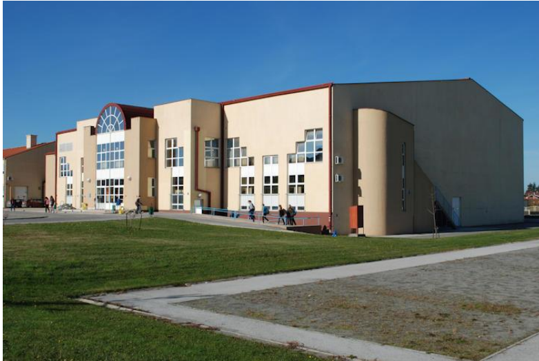
Slika 2. Dvorana Osnovne škole Kralja Tomislava Našice

Izvan klasičnih sportskih disciplina, Našice su također domaćin raznih sportskih događanja i manifestacija koje privlače pažnju šire publike punu entuzijazama i zajedništva. Našice ne samo da slave uspjehe svojih sportaša, već i podržavaju svakoga tko želi sudjelovati i dati sve od sebe. Sportski duh koji se proteže kroz Našice odražava se u svakodnevnom životu stanovnika, inspirirajući ih da se bave fizičkom aktivnošću, razvijaju svoje talente i grade trajne veze sa svojom zajednicom. Našice nije samo grad, već i sportsko središte koje pulsira energijom, strašću i željom za postizanjem viših ciljeva.