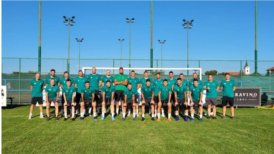
Slika 10. RK NEXE na početku priprema za sezonu 2023./24.

Klub je kroz povijest osvojio velik broj trofeja na lokalnoj razini kao najbolji klub grada Našica i najbolji sportski kolektiv Osječko-baranjske županije. (Čalić, 2013.) Značajniji uspjesi na državnoj i europskoj razini počinju od sezone 2008./09. RK NEXE je do sada sveukupno bio doprvak Hrvatske 14. puta te je to njegov najveći uspjeh. U hrvatskom kupu su također višestruki doprvaci države. Također, od sezone 2008./2009., RK NEXE je postao redoviti sudionik europskih natjecanja u rukometu. Klub je stekao pravo sudjelovanja u tim natjecanjima zbog svojih rezultata i igračke kvalitete, što je omogućilo igračima i navijačima da dožive natjecanje na međunarodnoj razini. Najbolji rezultat je bio u sezoni 2021./22. kada su se plasirali na Final Four Europske rukometne lige. Taj rezultat ujedno označava i jedan od najboljih rezultata hrvatskog klupskog rukometa. Uspjeh i kvaliteta idu uzlaznom putanjom te će sigurno u slijedećim godinama doći i do prvih trofeja. ( https://www.rknexe.hr/ )