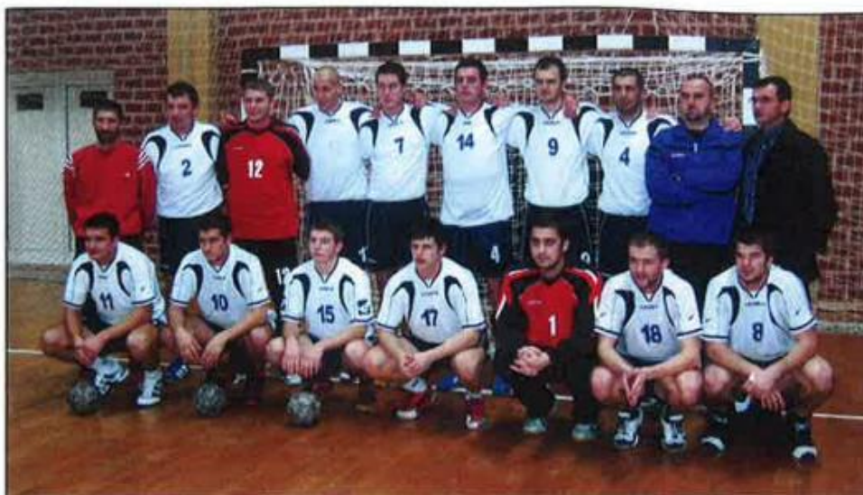
Slika 8. Seniori kluba – sezona 2005./06.

Od sezone 2006./07. klub se natječe u 1. hrvatskoj rukometnoj ligi – „Liga 12“ pod novim imenom RK „NEXE“ i zauzimaju visoko treće mjesto. Sljedeću sezonu ekipa se natječe u „DUKAT 1. HRL“ i ostvaruje izvanredan uspjeh – treće mjesto u konkurenciji 16 prvoligaških klubova. Sada se ekipa RK „NEXE“, osim što nastupa u Premijer Dukat 1. HRL natječe i u Kupu hrvatske, te po prvi puta u povijesti Grada Našica, nastupa i u jednom Europskom natjecanju – Kupu EHF-a. Nakon prve utakmice u Kupu EHF-a i uvjerljive pobjede protiv KH Prishtine, klub mijenja trenera. Novi trener je Kasim Kamenica. U natjecateljskoj 2008./09. godini klub se natječe u istoj ligi i klub postaje viceprvak države iza RK „CROATIA OSIGURANJE“. (Čalić, 2013.)