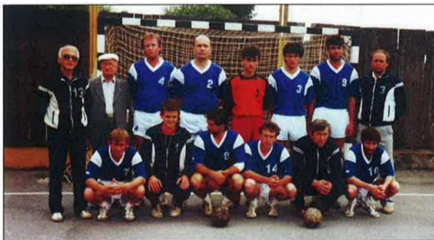
Slika 6. Ekipa seniora iz 1989. godine

Teško i vrlo napeto stanje u bivšoj državi odrazilo se, dakako, i na odnose u RK „Partizan“ u Našicama. Većina članova Predsjedništva kluba nije dala potporu dosadašnjem dugogodišnjem predsjedniku kluba Vladimiru Olbini, počasnom predsjedniku kluba Stjepanu Markoviću i trenerima, a to su bili ljudi koji su vukli najveći teret u radu kluba. (Čalić, 2013.)