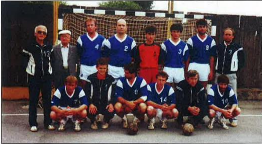
Slika 6. Ekipa seniora iz 1989. godine

Teško i vrlo napeto stanje u bivšoj državi odrazilo se, dakako, i na odnose u RK „Partizan“ u Našicama. Većina članova Predsjedništva kluba nije dala potporu dosadašnjem dugogodišnjem predsjedniku kluba Vladimiru Olbini, počasnom predsjedniku kluba Stjepanu Markoviću i trenerima, a to su bili ljudi koji su vukli najveći teret u radu kluba. (Čalić, 2013.)