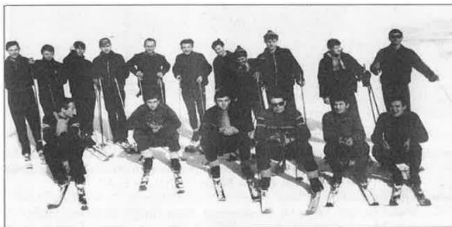
Slika 5. Zimske pripreme u Orahovici 1965./66. godine

Uprava kluba je u to vrijeme nastojala omogućiti pripreme ekipi i izvan Našica. Tako je seniorska ekipa u zimskom razdoblju 1965. i 1966. godine provela pripreme s obukom skijanja u Centru za predvojničku obuku u Orahovici (Slika 5).