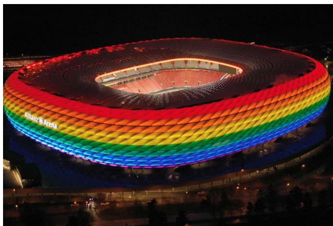
Slika 12. Allianz arena, Munchen Njemačka, za vrijeme EURO-a 2020.

Njemački nogometni savez ( DFB ) se malo po malo počeo zalagati protiv homofobije u nogometu te su na stadionu Bayerna na utakmici između Njemačke i Mađarske , upalili svijetla u duginim bojama što je znak podrške prema LGBT osobama. ( https://choice.npr.org/index.html?origin=https://www.npr.org/2021/06/23/1009360659/german-stadiums-will-show-their-rainbow-colors-to-support-hungarys-lgbtq-communi )