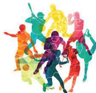
Slika 2. Sportovi

Sport je raširena i popularna društvena pojava, sastavni dio kulture suvremenoga društva. Cilj sporta je nadmetanje sa protivnikom ili protivnicima uz primjenu pravilnog sustava bodovanja da bi se ostvario pobjednik. Sportove možemo podijeliti u dvije kategorije a to su : grupni i samostalni. U grupne sportove spadaju sportovi poput nogometa, rukometa, košarke, odbojke, vaterpola i slično, a u samostalne spadaju atletika, gimnastika, judo, fitness, itd. Razlika između tih dvaju grupa je u tome što se kod grupnih ( zajedničkih ) sportova natječe grupno, dok kod samostalnih je pojedinac taj koji se samostalno zalaže za svoj uspjeh u određenom sportu. Za sport možemo reći i da je vrlo bitan, čak i sastavni je dio društvenih potreba pojedinca. Njime se potiče suradnja između više ljudi koji imaju zajednički cilj a to je poboljšanje vlastitog zdravlja, socijalizacije, fizičkog i duhovnog odgoja te same kvalitete života.