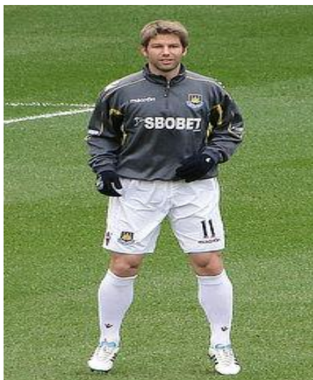
Slika 7. Thomas Hitzlsperger