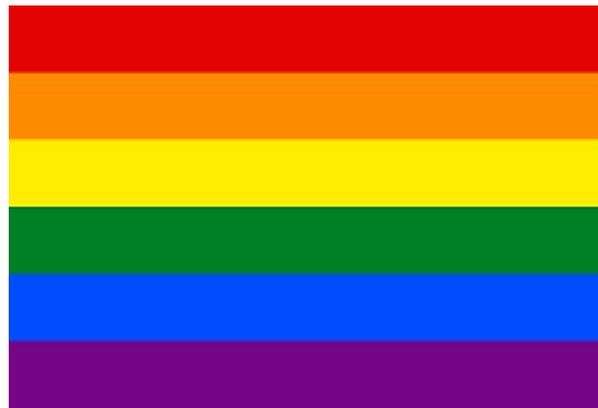
Slika 1. Zastava LGBT zajednice

Svrha ovog rada je da se ukažu problemi današnjice s kojima se susreću osobe u sportu koje zanima isti spol. Homofobni ispadi se često događaju u sportu ali se takvim stvarima ne pridodaje previše medijske pažnje nego se tu i tamo može pročitati nekakav ispad prema LGBT osobama. Značenje izraza LGBT je ( L- lesbian, G- gay, B- bisexual, T- trans ). Problem koji se događa u svijetu sporta je što ima mnogo sportaša, navijača i ostalih sudionika koji ne prihvaćaju osobe koje se deklariraju kao LGBT te ih ne žele da sudjeluju u sportu zbog nekih njihovih razloga. Tada se događa da takve osobe pretrpljuju veliku mržnju od strane navijača na utakmicama ( najčešće u nogometu ) i zbog toga ne mogu ispuniti svoje ciljeve jer imaju konstantu vanjsku prijetnju i strah od takvih ljudi. Najviše se navijači koriste ružnim povcima sa tribina i skandiranjem pa čak i transparentima, dok suigrači ili sportaši ne pričaju o tome javno jer im može oštetiti karijeru , ipak postoje slučajevi koji isplivaju na površinu. Takvih slučajeva samo kod nas u Hrvatskoj ima puno a kamoli onda u svijetu.