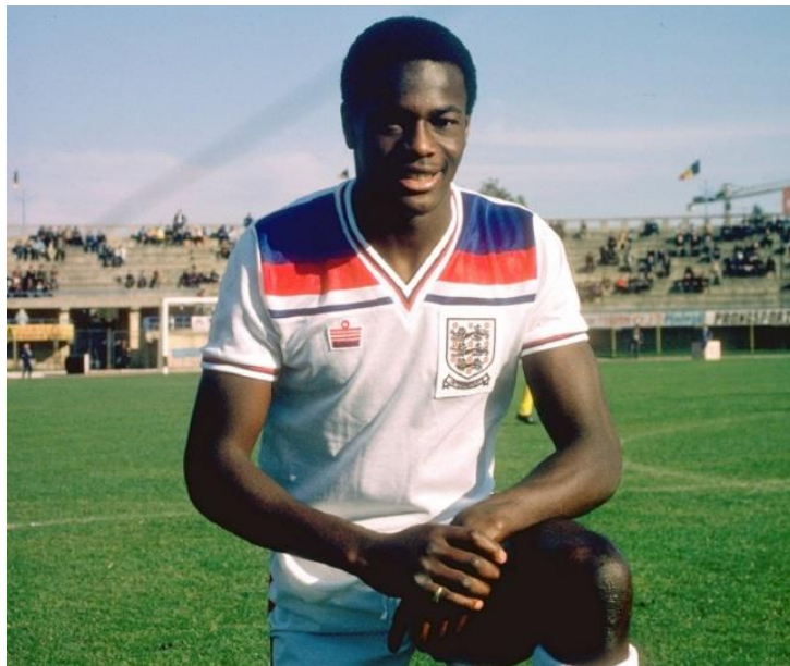
Slika 5. Justin Fashanu

2. Justin Fashanu ( Englez ) – Karijera- 1978.-1997., deklarirao se 1990. godine