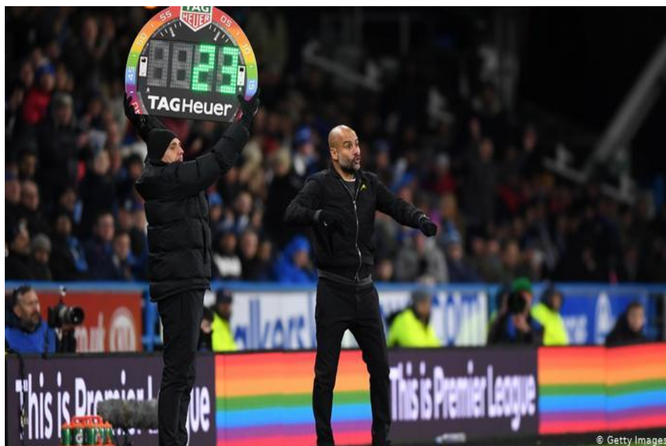
Slika 3. Zastava LGBT zajednice na nogometnoj utakmici