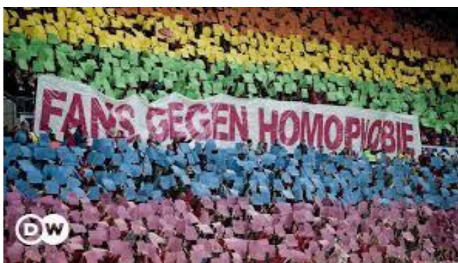
Slika 11. „Navijači protiv homofobije“

Na Njemačkoj nogometnoj sceni, prisutne su 2 glavna aspekta homofobije. Prvi aspekt odnosi se na homofobna skandiranja i povike sa tribina. Dok drugi aspekt je da nedostaje homoseksualnih nogometaša na najvišoj razini koji su otvoreno priznali da su homoseksualci. Zato nas ne čudi što u Njemačkoj Bundes Ligi još nema slučaja da je neki nogometaš otvoreno priznao da je homoseksualac. Što se tiče Njemačkog nogometnog saveza i čelnih ljudi općenito, jednostavno nema dovoljno zajednica ili pokreta koji bi se zagovarali za LGBT osobe i probali iskorijeniti homofobiju iz nogometa.