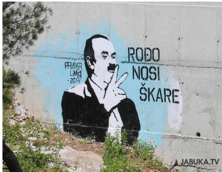
Slika 16. Grafit „Rođo nosi škare“

Njegova najpoznatija izjava protiv homoseksualaca je „...Rođo nosi škare“, što upućuje na to da bi on homoseksualcu za vrijeme tuširanja škarama odrezao spolovilo. U Širokom Brijegu u Hercegovini dobio je svoj grafit na kojem piše „Rođo nosi škare“.