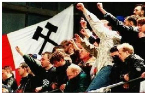
Slika 8. Prikaz Engleskih navijača na stadionu