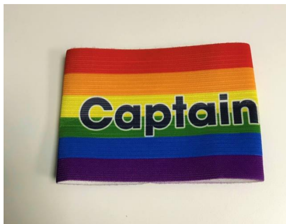
Slika 10. Kapetanska traka u Engleskoj Premier Ligi

Navijači u Engleskoj su tretirani kao iznimni homofobi, što i ne čudi jer u izvještaju najveće LGBT grupe u Engleskoj, Stonewall, stoji da je preko 70 posto navijača u Engleskoj Premier Ligi, Championshipu, Ligama 1 i 2, skandiraju protiv homoseksualaca. ( https://forum.tm/vijesti/porast-rasizma-i-homofobije-u-engleskom-nogometu-6420 )