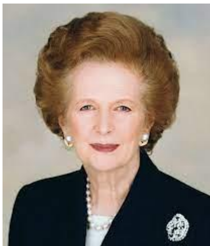
Slika 9. Margaret Thatcher