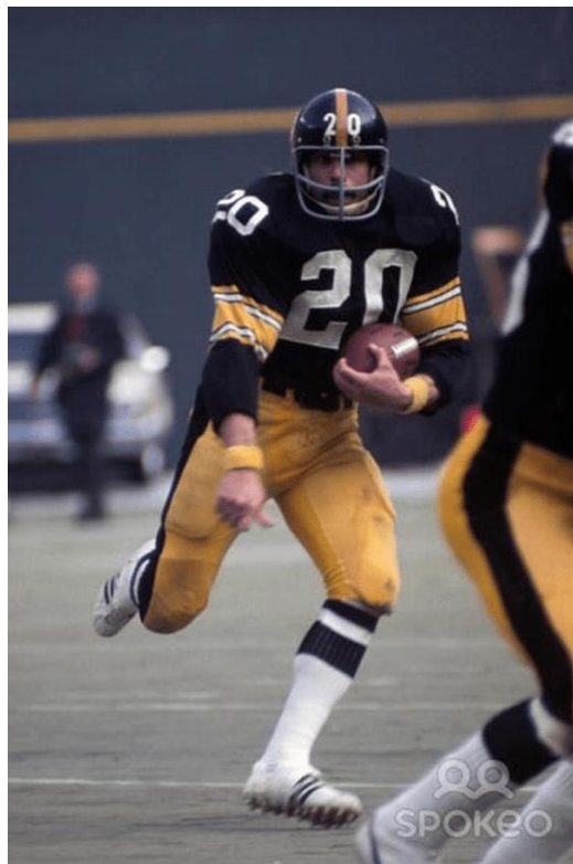
Slika 3 Rocky Bleier

Priča o Rockyju Bleieru priča je o herojstvu, hrabrosti i predanosti. Rocky je bio profesionalni nogometaš Pittsburgh Steelersa, a tek je započeo svoju početničku sezonu kad je izbio Vijetnamski rat. Pozvan je u službu krajem 1968., a s lakom pješacom pukovnijom kao grenadir otpremljen je u Južni Vijetnam. Dok je bio u ophodnji, njegova je četa bila pod jakom vatrom, a Rocky je pogođen neprijateljskim gelerom i puškom u noge. Nakon što su ih spasili, Rocky je dobio Purple Heart i brončanu zvijezdu. Ozljede koje je Rocky zadobio bile su značajne, što je dovelo do djelomičnog gubitka jedne noge što je zahtijevalo više operacija (Ranker, 2019).