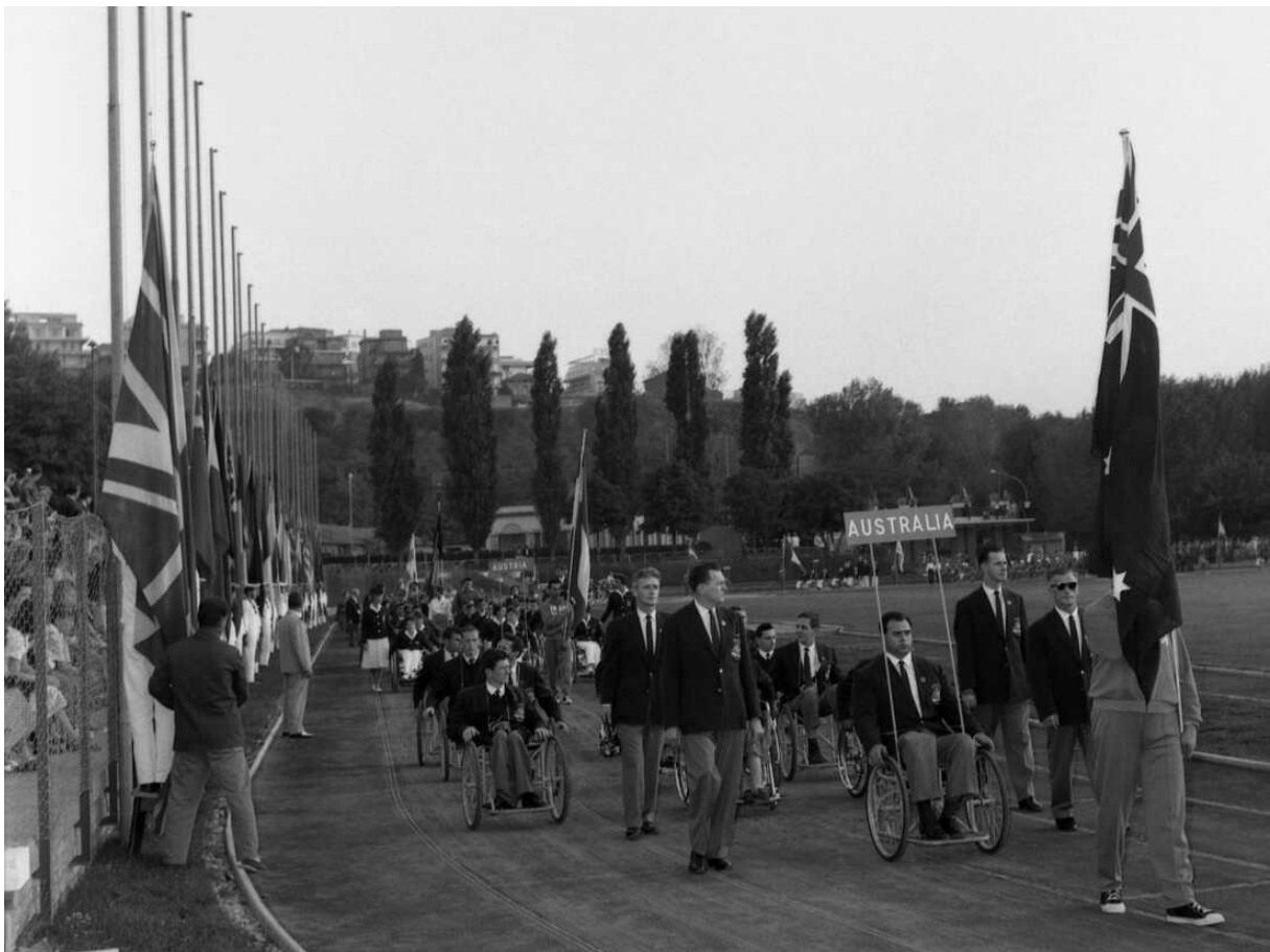
Slika 1 Australaska ekipa defilira oko terena Acqua Acetosa u Rimu 18. rujna 1960. tijekom svečanog otvaranja Paraolimpijskih igara.

Sportovi za sportaše s invaliditetom postoje više od jednog stoljeća, ističe Međunarodni paraolimpijski odbor (Treisman, 2021). No, tek nakon Drugog svjetskog rata počele su se oblikovati službene Paraolimpijske igre, u nastojanju da se pomogne brojnim veteranima i civilima koji su u tom razdoblju ozlijeđeni.