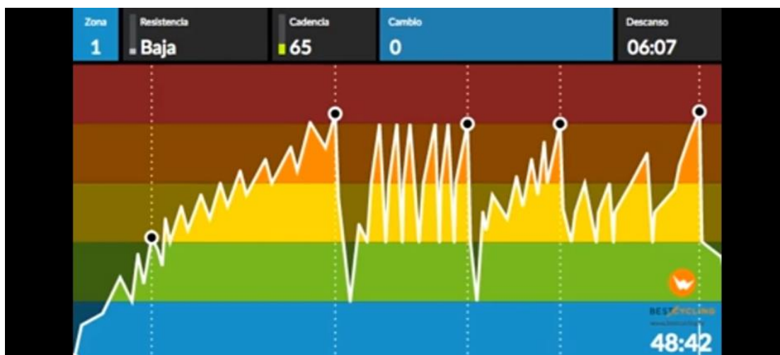
Slika 9. Prikaz provedenog treninga