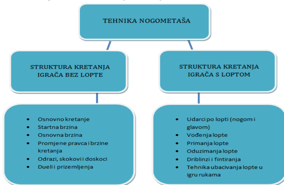
Slika 1. Shematski prikaz aktivnosti nogometne igre

Aktivnosti koje igrač izvodi tijekom nogometne utakmice mogu se podijeliti u dvije kategorije: aktivnosti bez lopte i aktivnosti s loptom.