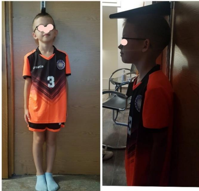
Slika 4. Mjerenje tjelesne visine igrača

Tjelesna težina (TT) nogometaša mjerena je pomoću digitalne vage (Slika 5). Vaga je postavljena na ravnu površinu na tlu. Ispitanik je u sportskoj opremi stao na vagu, bez obuće, te je nakon toga očitana rezultat. Mjerenje je provedeno jedan put za svakoga igrača, a rezultat je evidentiran u kilogramima (kg).