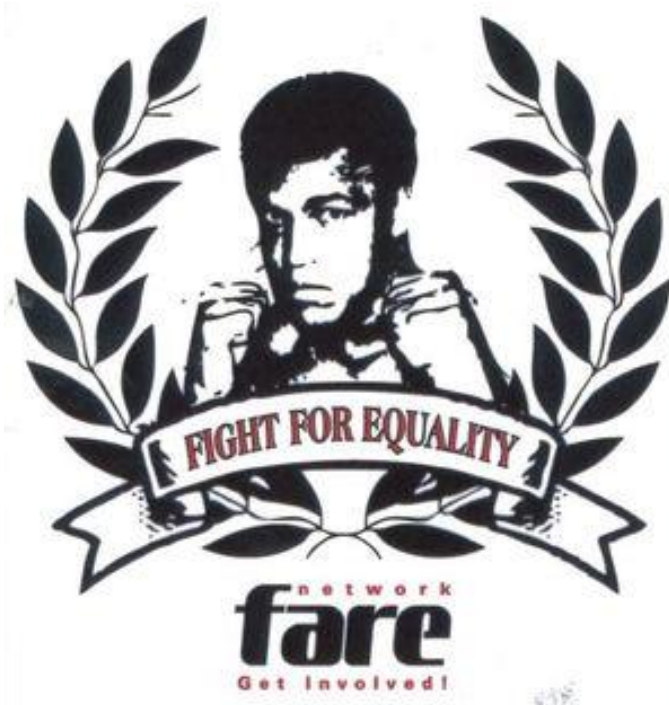
Slika 5.1. Simbol FARE mreže.