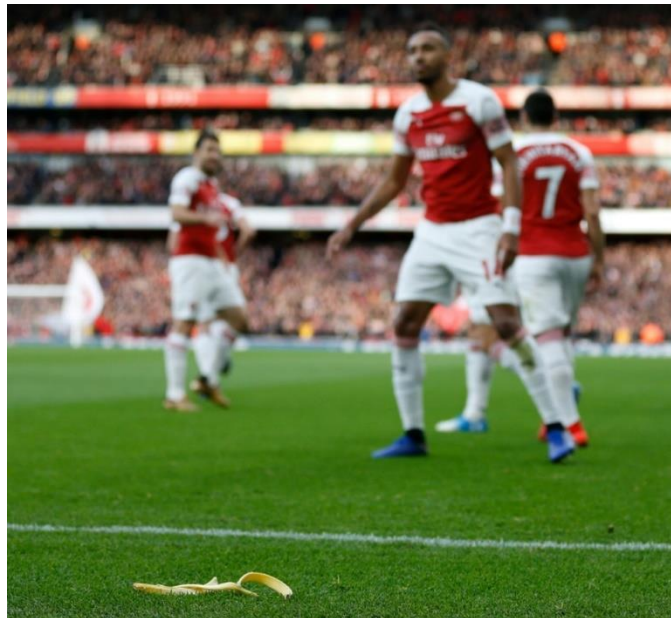
Slika 4.3. Banane bačene na nogometno igralište tijekom utakmice.

karijere susreli su se sa raznim rasističkim napadima i uzvicima od strane navijača sa tribina. Fabio Liverani bio je jedan od prvih, a potom i Mario Balotelli koji su se našli na meti rasističkih navijača koji ih nisu podržavali. Najzanimljiviji scenarij je bio kada su im sa tribina bacali banane i gestikulirali pokrete oponašajući majmune aludirajući da im mjesto nije na terenu nego u džungli (Horvat, 2018).