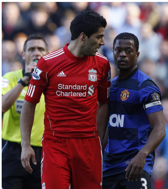
Slika 4.2. Verbalni sukob između igrača Patrice Evra i Luiz Suarez na temelju rasne nejednakosti.