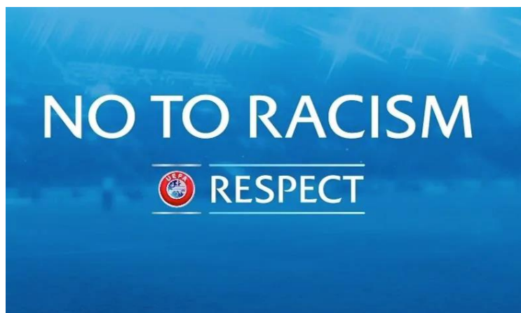
Slika 5.5. UEFA-ina kampanja „No to Racism“.