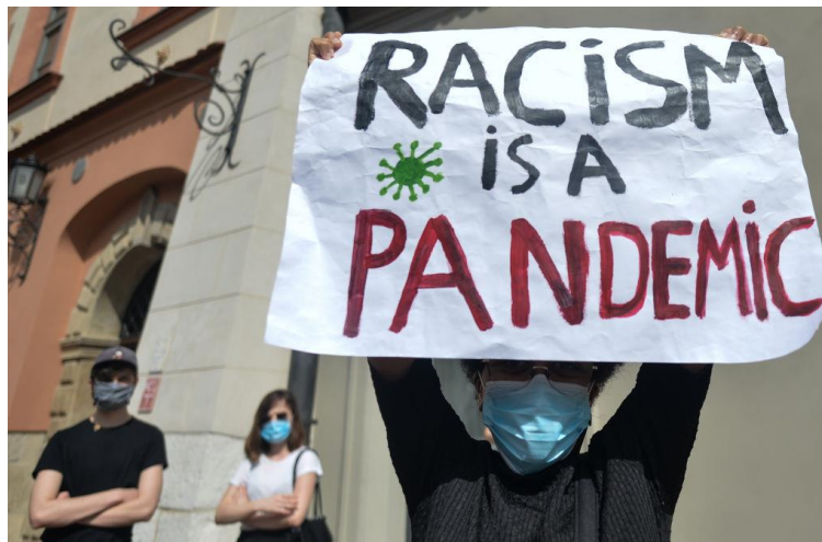
Slika 3.1. Prikaz pobunjenika koji govori da je rasizam zapravo pandemija.