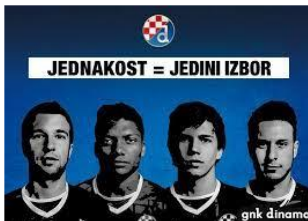
Slika 5.4. Kampanja GNK Dinama - „Jednakost=jedini izbor“.

Kako bi se istaknulo bogatstvo različitosti, igrači različitih boja kože, nacionalnosti i materinjih jezika su u sklopu kampanje „Jednakost=jedini izbor“ bili pozvani da preko videoporuka istaknu bogatstvo različitosti. To je sve dio klupskog „Projekta prevencije i sprječavanja nasilja, rasizma i drugih oblika netolerancije u nogometu” u GNK Dinamu koji traje od 2012. godine (Gnkdinamo.hr, 2015).