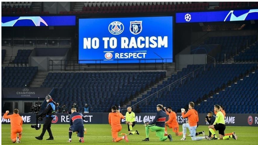
Slika 4.1. Nogometaši prije utakmice kleće zbog rasne nejednakosti u nogometu.

U svojim ranim fazama smatralo se samo kao problem ponašanje navijača i igrača, koji nisu prihvatili igrače koji ne dijele njihovu boju koža. Međutim, presuda Bosmana prebacila je ovu diskriminaciju na igrače drugih momčadi. Prirodno je da su se velike antirasističke kampanje nastojale boriti protiv takve vrste ponašanja (Armenia, 2019). Posljedično, napad na tornjeve blizance postavio je kulturu i religiju kao žarište točke rasizma u nogometu. Nije se razlikovalo od rasizma po boji kože; samo, fokus napada se promijenio. Kao rezultat toga, kampanje protiv rasizma proširile su svoj fokus ne samo na boju kože nego i kulturni identitet (Armenia, 2019).