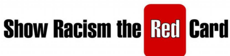
Slika 5.6. Kampanja „Pokažimo rasizmu crveni karton“.

Udruga „Nogometni sindikat“ je u sklopu FARE akcijskih tjedana napravila kratak video pod nazivom „Pokažimo rasizmu crveni karton“ za sve prvoligaške klubove i njegove članove kako bi dali svoj doprinos u borbi protiv rasizma i diskriminacije na stadionima (Huns.hr, 2014).