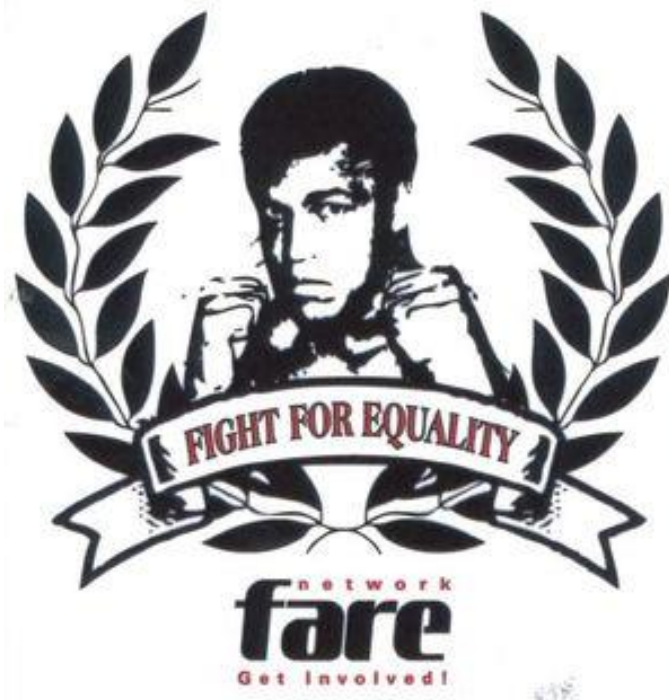
Slika 5.1. Simbol FARE mreže.