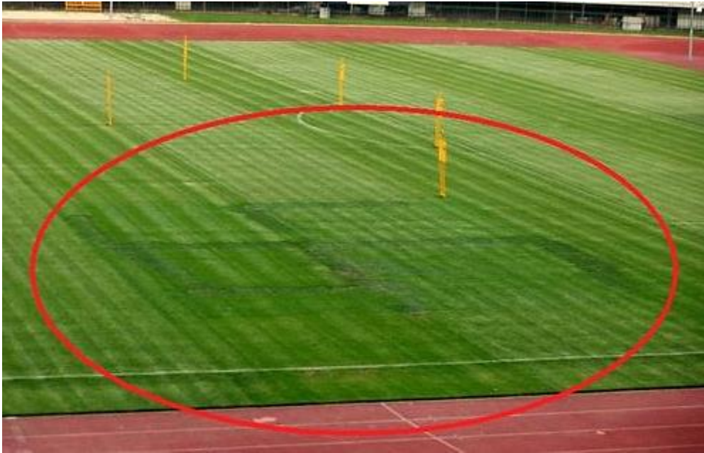
Slika 4.4. Simbol kukastog križa iscrtanog na travnjaku.

od najtežih kazni u povijesti, bio je za vrijeme kvalifikacija za Europsko prvenstvo 2016. godine kada je na terenu uoči utakmice Hrvatska-Italija osvanuo fašistički simbol kukastog križa (najvjerojatnije iscrtan kosilicom za uređenje travnjaka ili kemikalijom koja je „spržila“ travnjak) te nakon što se Talijanski nogometni savez žalio Europskom nogometnom savezu, HNS je dobio kaznu oduzimanja jednog boda u europskim kvalifikacijama, idućim dvjema domaćim utakmicama bez publike i kaznom Hrvatskom nogometnom savezu od čak 100.000 eura (Lisec, 2015).