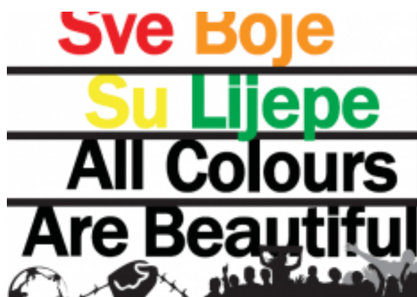
Slika 5.2. Logo kampanje „Sve boje su lijepe“.