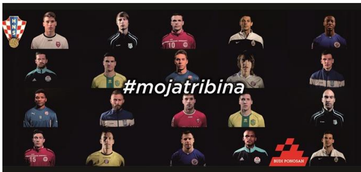
Slika 5.3. HNS-ova kampanja #mojatribina.

Iduća kampanja je „#mojatribina“ pokrenuta od strane HNS-a koja je preko videospotova pozvala navijače i sve ljubitelje nogometne scene na širenje pozitivne atmosfere bez rasizma, diskriminacije i nasilja (Hns-cff.hr, 2015).