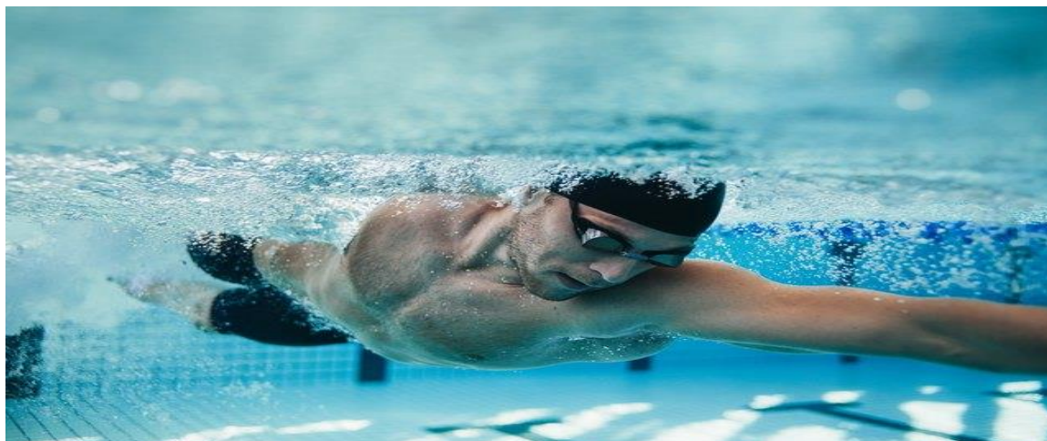
Slika 4. odrasli plivač

Program se provodi u sklopu 20 nastavnih sati, odnosno sukladno potrebi i želji polaznika. Kroz nastavu je obuhvaćena poduka neplivača te sportska poduka u smislu usavršavanja znanja plivanja (plivačke tehnike). Moguće je provođenje programa individualno ili u manjim skupinama (do tri polaznika).