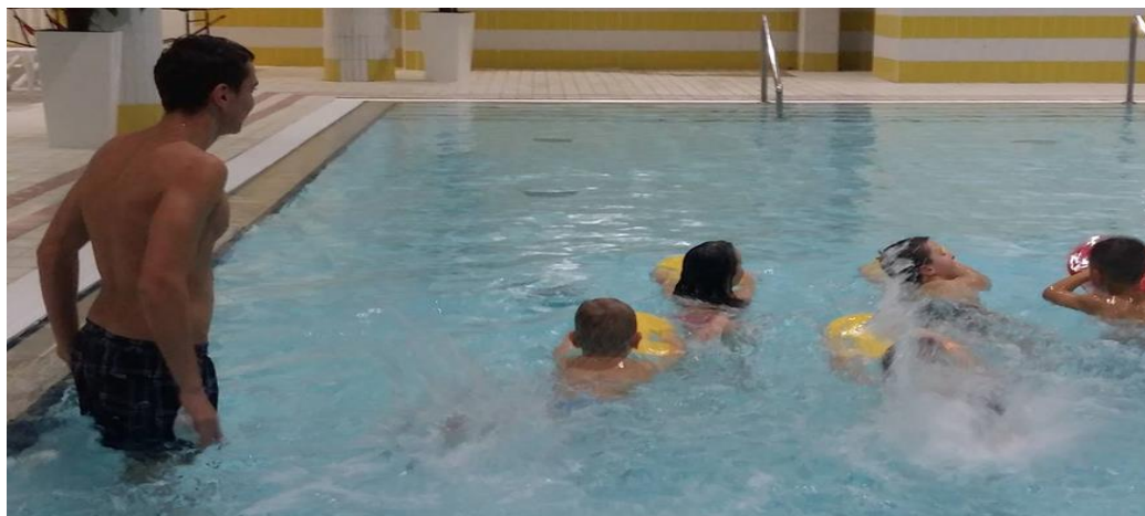
Slika 2. Škola plivanja