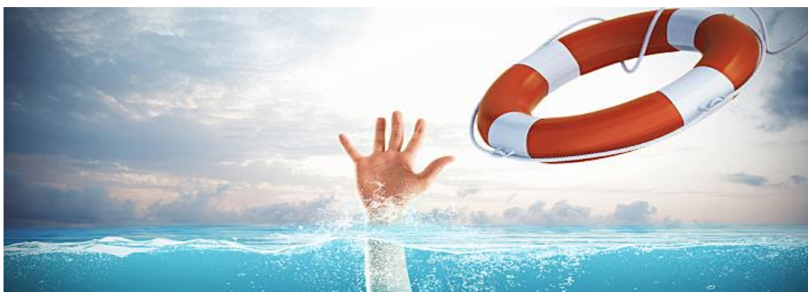
Slika 5. Spašavanje od utapanja