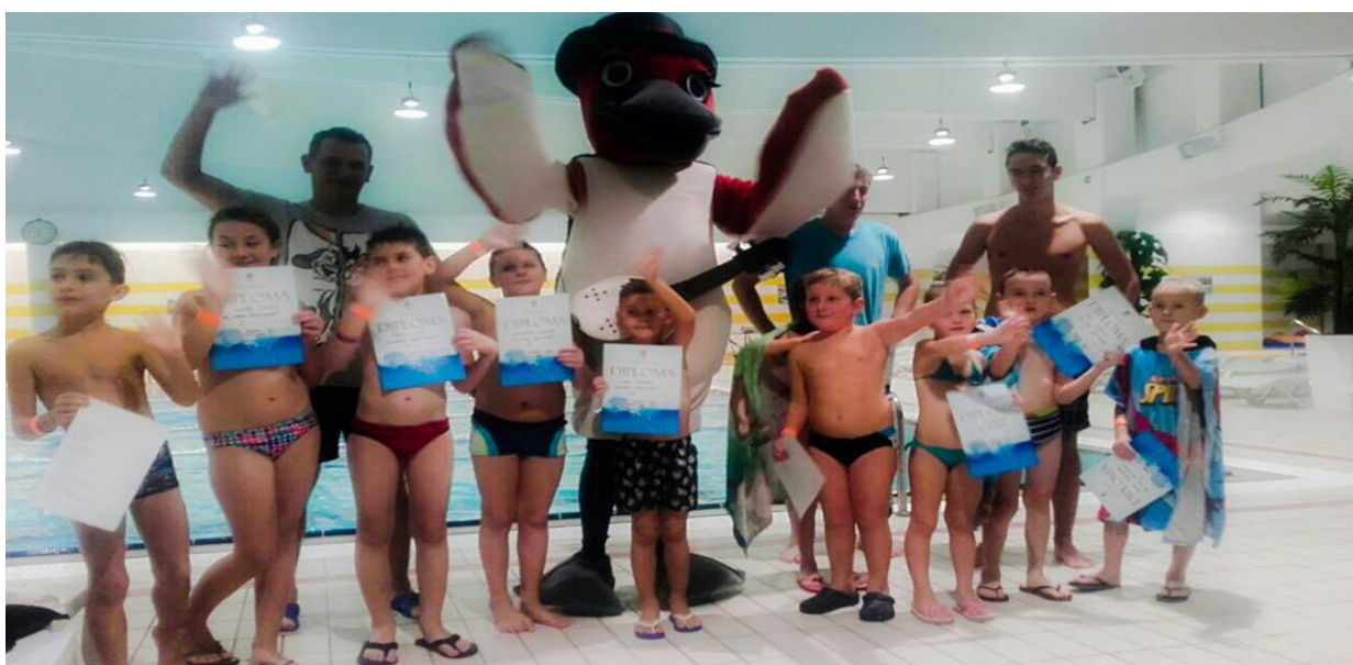
Slika 3. Škola plivanja polaznici

U sklopu programa uče se plivačke tehnike (kraul, leđno, prsno i delfin) te se podučava njihovoj primjeni sukladno interesima. Poseban se naglasak daje sigurnosti i samopouzdanju u vodi te usmjerenju prema plivačkom sportu. Program je moguće provoditi i individualno.