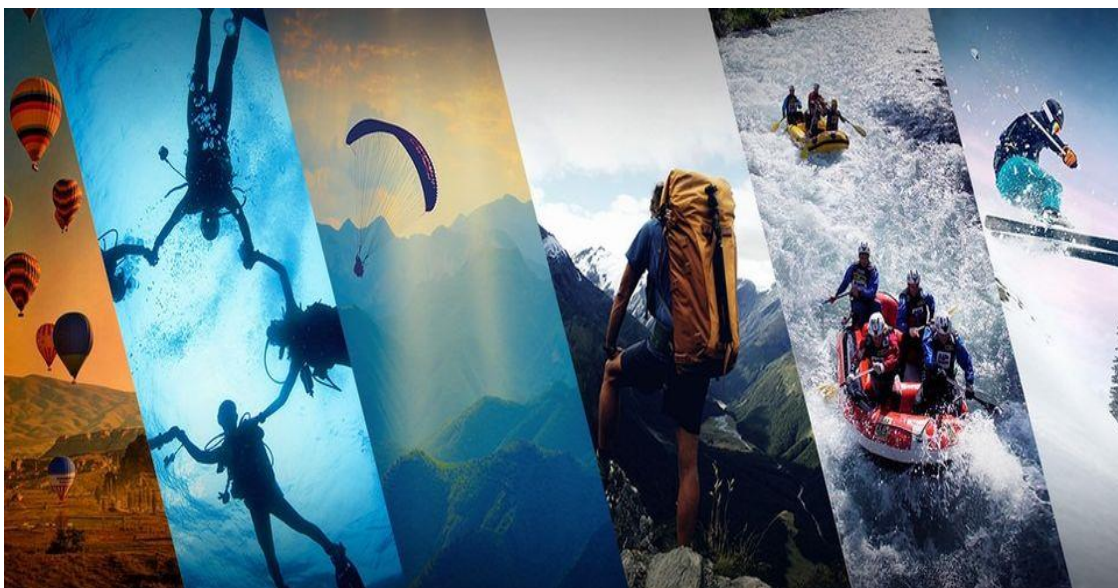
Slika 1. Aktivnosti u sadržaju sportskog turizma

Suvremeni turizam uz promjenu svjetskog trenda u turističkoj potražnji, označava sve veću potražnju za aktivnim oblikom odmora. Turisti su postali zahtjevniji i u potražnji za onim što odgovara njihovim posebnim potrebama. Koncept kupališnog turizma se napušta i povećava se razvoj sportsko-rekreacijskog, rehabilitacijskog i avanturističkog turizma, a samim time želja za bavljenjem sportom i brigom o zdravom životu. U današnjem sportskom turizmu sport postaje koncept boravka i jedan od glavnih motiva zašto turisti putuju na odabrana turistička odredišta. Rekreativne su aktivnosti postale posebna i selektivna djelatnost koja se sve više provodi i organizira s turistima, kako bi se ispunile njihove potrebe za tjelesnom aktivnošću (Bartoluci M., 2004.).