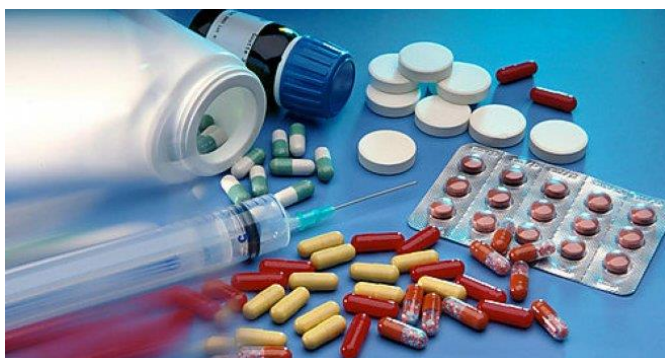
Slika 1. Razne vrste dopinga

Vitamini su tvari koje se čak mogu smatrati dopingom, jer neki vitaminski kompleksi pomažu u postizanju priljeva sile, a njihova uporaba u velikom broju može se tumačiti kao kršenje pravila Antidoping kodeksa. (Doping u sportu, 2021.)