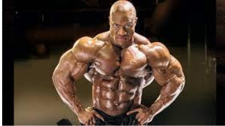
Slika 3. Phil Heath kao bodybuilder