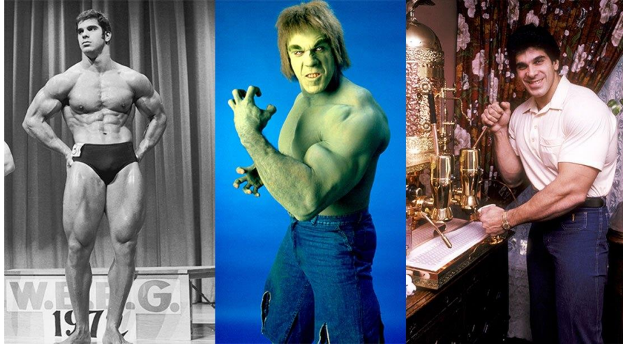
Slika 5. Lou Ferrigno kao bodybuilder