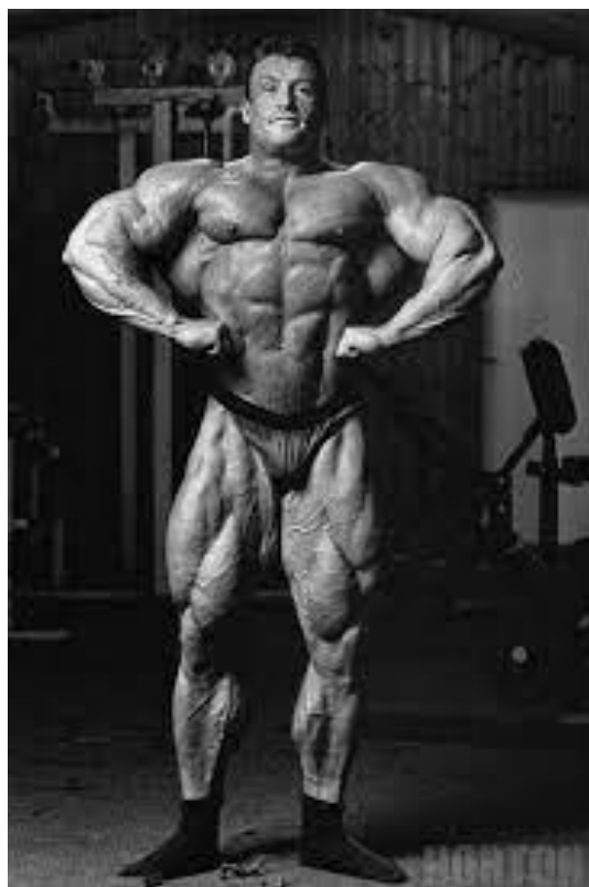
Slika 4. Dorian Yates kao bodybuilder