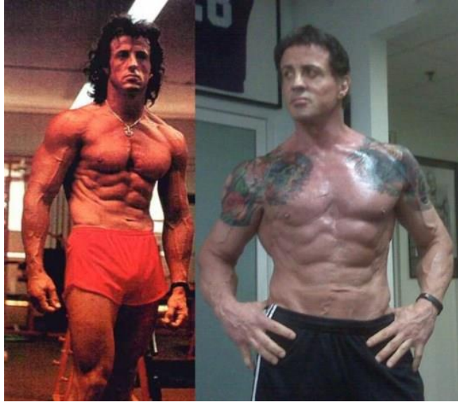
Slika 6. Sylvester Stallone kao bodybuilder