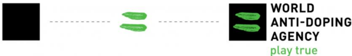
Slika 7. Logo WADA-e

Također, postoji priča o njezinom logotipu koji je prikazan slikom ispod.