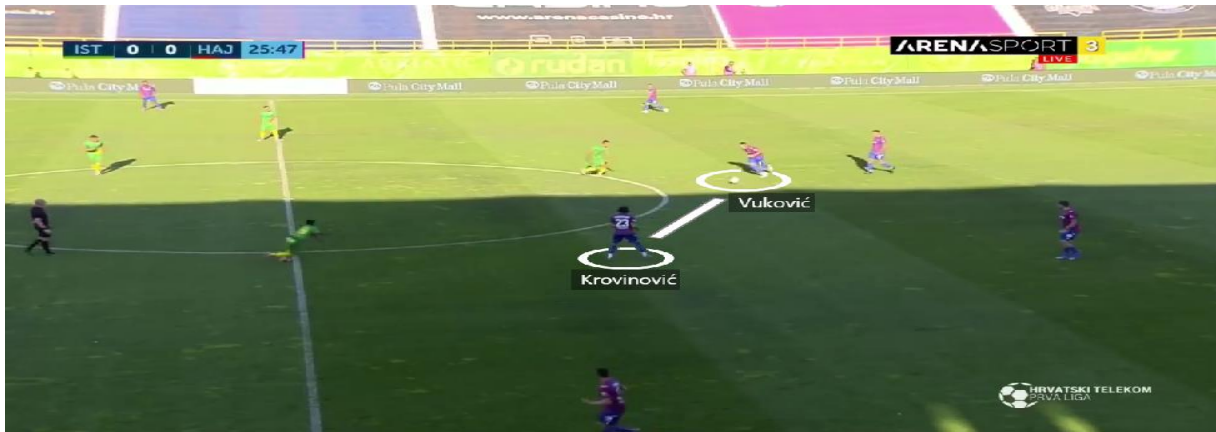
Slika 4. Početak izgradnje napada preko dvojice veznih igrača

Duge lopte od središnjih braniča te veznih prema napadačima bile su najčešći pokušaji dolaska do protivničkog gola. Kad bi se osvojio prostor u sredini terena, dodavanja bi najčešće išla prema krilnim igračima, Sahitiju i Eduoku koji su driblinzima pokušavali stvoriti višak te uputiti udarac prema голу ili proigrati napadače (Slika 5).