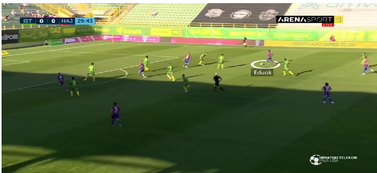
Slika 5 . Završnica akcije preko krilnog igrača

Duge lopte od središnjih braniča te veznih prema napadačima bile su najčešći pokušaji dolaska do protivničkog gola. Kad bi se osvojio prostor u sredini terena, dodavanja bi najčešće išla prema krilnim igračima, Sahitiju i Eduoku koji su driblinzima pokušavali stvoriti višak te uputiti udarac prema голу ili proigrati napadače (Slika 5).