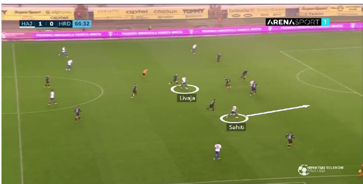
Slika 3. Asistencija za drugi pogodak

Slika 2. prikazuje bijelim poljima označene igrače HNK Hajduka, te bijelim strelicama njihove kretnje. Livaja okomitim dodavanjem pronalazi Sahitija koji je u punom sprintu nakon što se lažnim kretanjem oslobodio svog čuvara (slika 3).