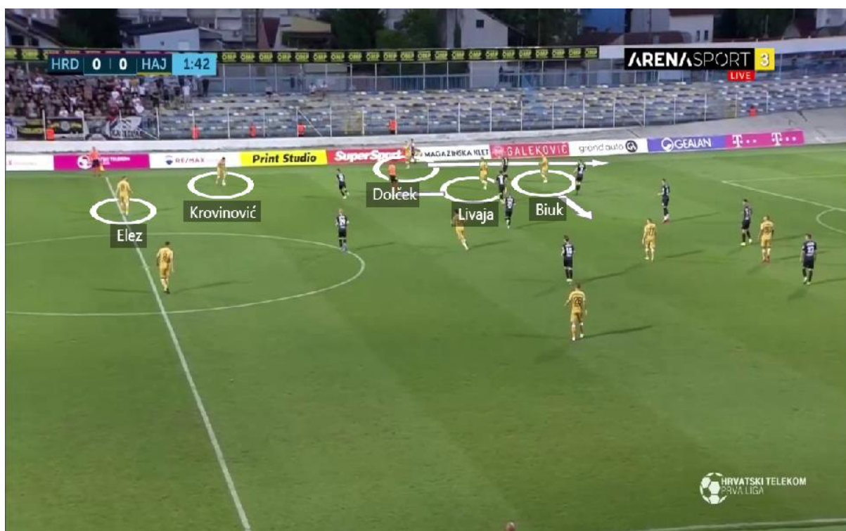
Slika 1. Taktička ideja trenera Gustafssona

HNK Hajduk je u toj utakmici zaigrao u formaciji 1-4-2-3-1. Jens Gustafsson na travnjak je poslao sastav: Posavec - Dolček, Elez, Simić, Lovrencsics - Atanasov, Krovinović-Biuk, Livaja, Sahiti – Ljubičić. Prvo poluvrijeme utakmice proteklo je u dominaciji gostujuće momčadi. Vratar HNK Hajduka nije zadržavao loptu u posjedu, a kad je imao, predao ju je igračima u obrambenoj liniji. Plan igre u prvom poluvremenu bio je spuštanje dvojice zadnjih veznih igrača Krovinovića i Atanasova po loptu kod središnjih braniča te pokušaj izgradnje napada preko njih. Krilni napadač, centralni napadač te središnji vezni tražili su loptu u međuprostoru i povlačili se u sredinu terena, te samim time otvarali prostor za bočne igrače. U konkretnom slučaju, Krovinović kao vezni igrač je došao na bočnu poziciju po loptu, te ju proslijedio Livaji koji je kao napadač došao između protivničkih linija. Krilni igrač Biuk ulazi u sredinu terena za igru te povlači svog čuvara za sobom kako bi napravio prostor za bočnog igrača Dolčeka (slika 1).