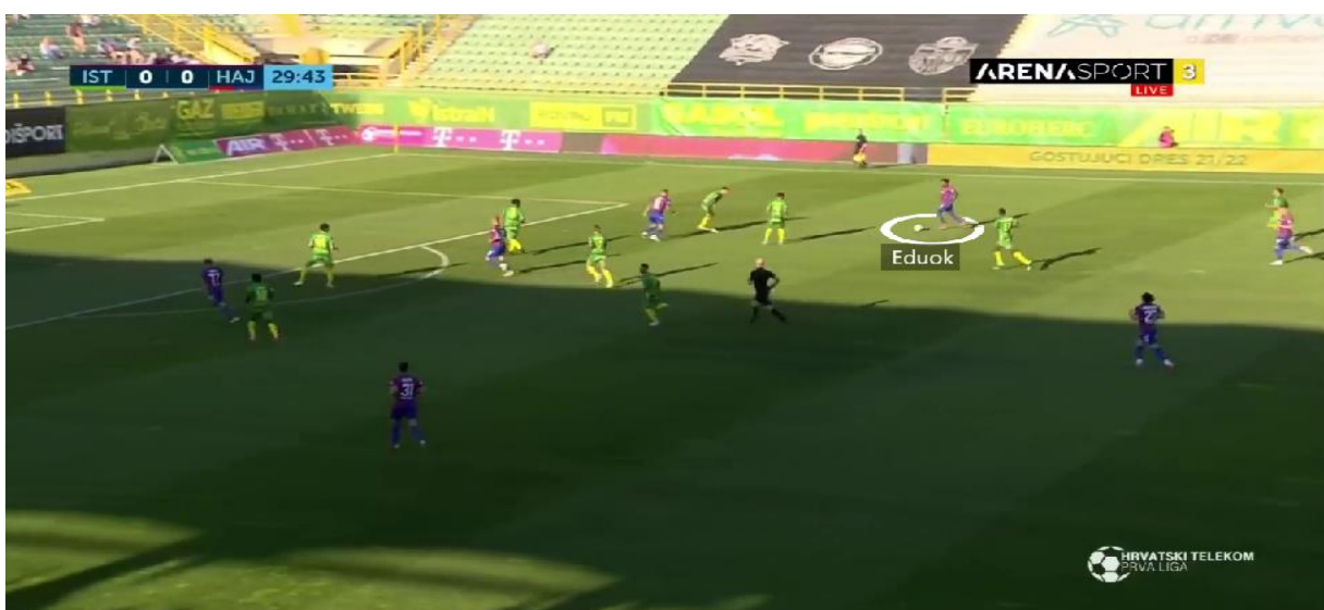
Slika 5 . Završnica akcije preko krilnog igrača

Duge lopte od središnjih braniča te veznih prema napadačima bile su najčešći pokušaji dolaska do protivničkog gola. Kad bi se osvojio prostor u sredini terena, dodavanja bi najčešće išla prema krilnim igračima, Sahitiju i Eduoku koji su driblinzima pokušavali stvoriti višak te uputiti udarac prema голу ili proigrati napadače (Slika 5).