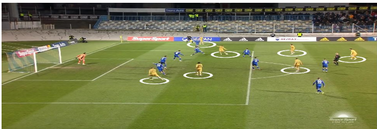
Slika 8. Akcija kod Ljubičićeva pogotka za 1:3

Kod udaraca iz kuta, šest je igrača bilo na skoku te još dvojica na povratnim loptama. Vratar Kalinić i njegova zamjena Subašić predaju loptu svojim obrambenim igračima te oni