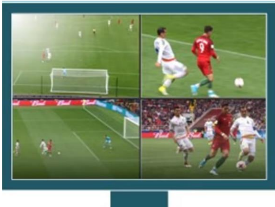
Slika 1. Četverostruki zaslon