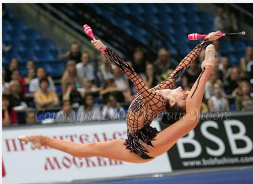
Slika 4. Čunjevi