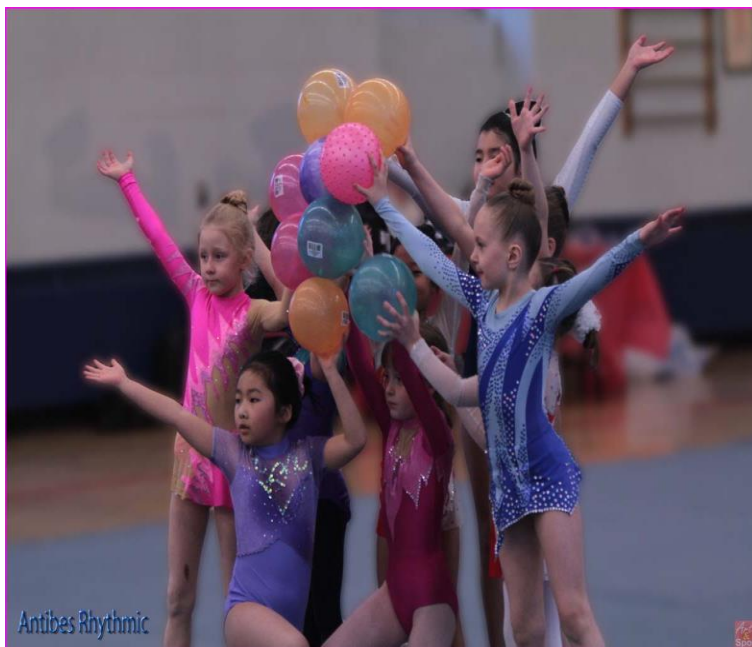
Slika 3: Lopta