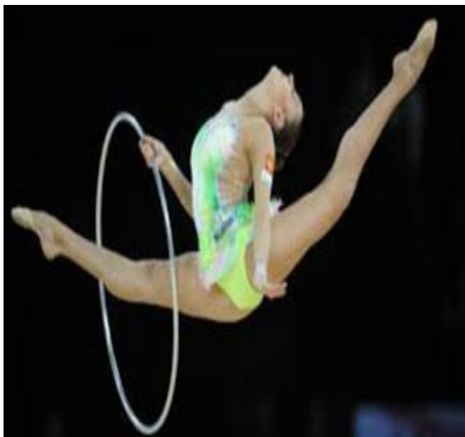
Slika 2. Obruč