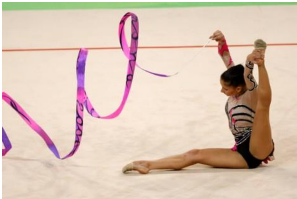
Slika 5. Traka