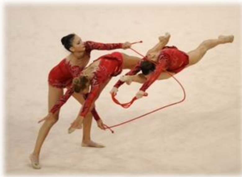
Slika 1. Vijača