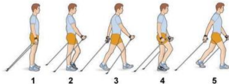
Slika 1 Nordijsko hodanje

U zaključku, nordijsko hodanje predstavlja siguran, učinkovit i pristupačan način da starije osobe održe ili poboljšaju svoje fizičko i mentalno zdravlje. Njegova jednostavnost, u kombinaciji s mnogobrojnim zdravstvenim prednostima, čini ga idealnom rekreativnom aktivnošću koja može značajno poboljšati kvalitetu života starijih osoba (slika 2).