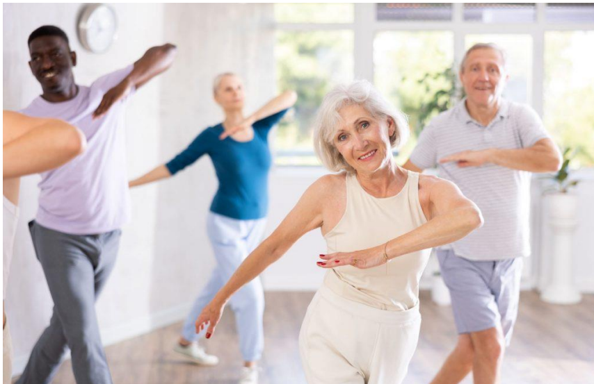
Slika 5 Sat zumba gold prilagođen starijoj životnoj dobi

Program Zumba Gold ne razlikuje se značajno od klasičnog Zumba fitness sata, već je prilagođen starijoj životnoj dobi te potiče razvoj svih komponenata fitnesa, uključujući kardiovaskularni sustav, mišićnu kondiciju, fleksibilnost i ravnotežu (Findak, 1999., Prskalo, 2004.).