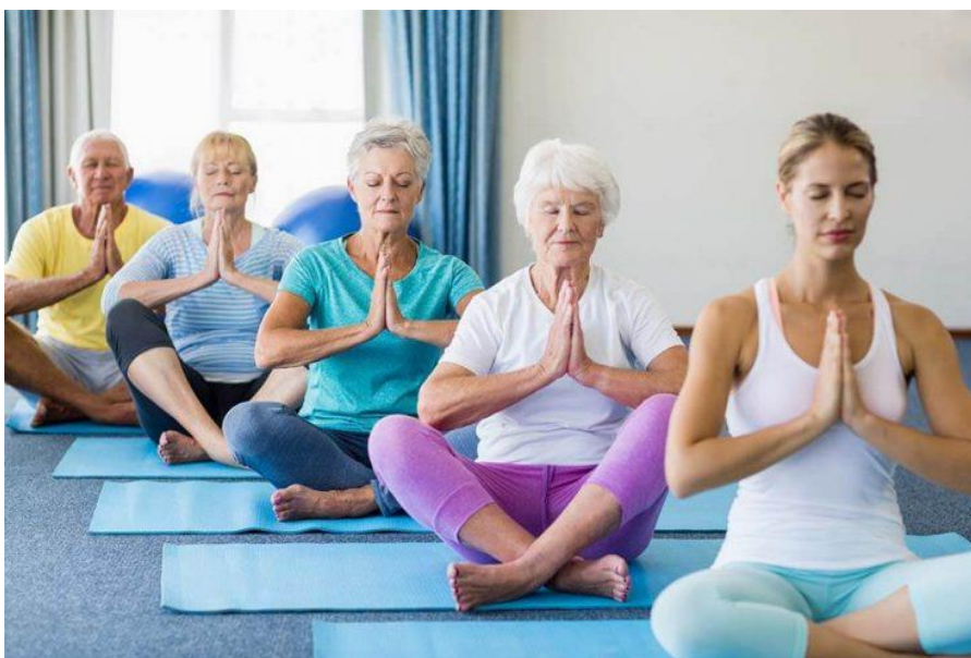
Slika 4 Sat joga