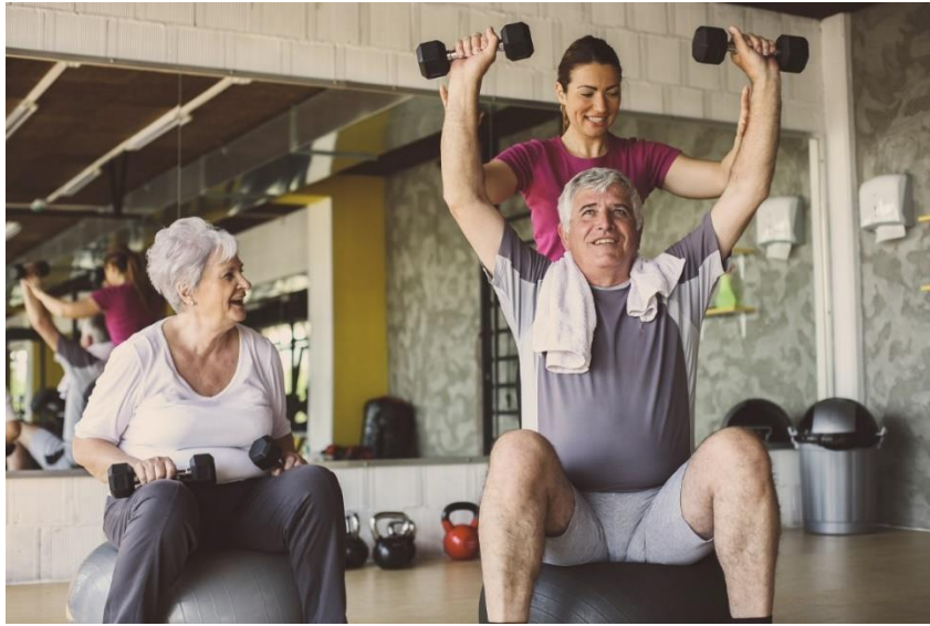
Slika 1 Vježbanje starijih osoba

Kako tjelesna aktivnost pozitivno djeluje na tijelo, tako se te promjene odražavaju i na mentalno i emocionalno zdravlje, dovodeći do općeg poboljšanja kvalitete života.