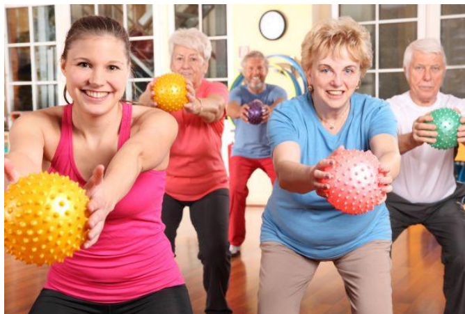
Slika 6 Pilates za starije osobe

Pilates je izvanredna metoda vježbanja koja može značajno doprinijeti fizičkom zdravlju i općem blagostanju starijih osoba. Prilagođene verzije pilatesa omogućuju sigurnu i učinkovitu tjelovježbu koja pomaže u održavanju neovisnosti, smanjenju rizika od ozljeda i poboljšanju kvalitete života u starijoj dobi (Findak, 1999., Prskalo, 2004).