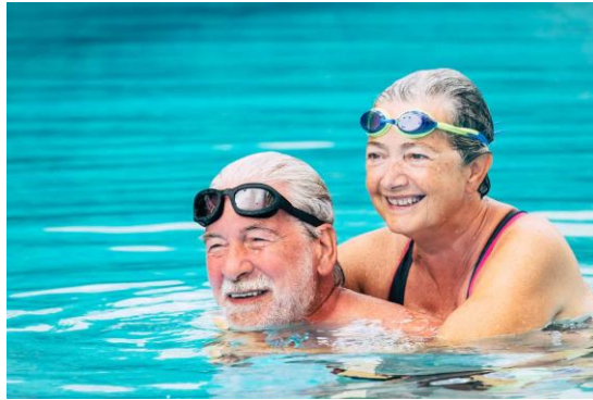
Slika 3 Plivanje kod starije populacije