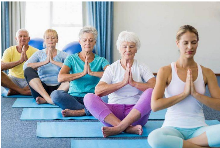
Slika 4 Sat joga