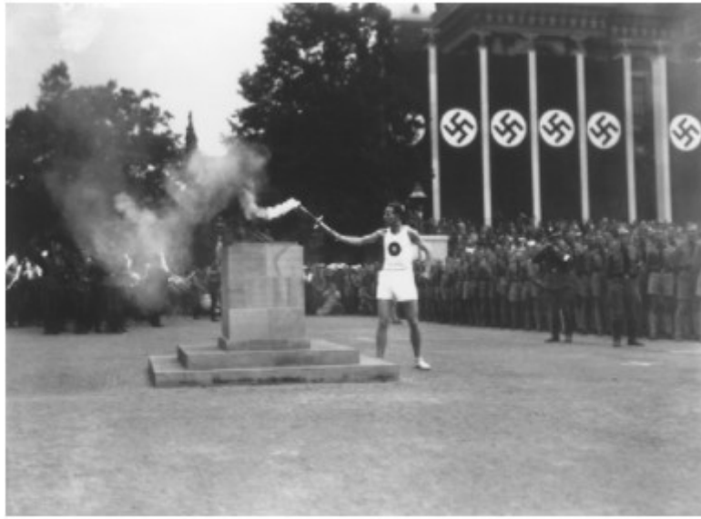
Slika 3. Paljenje Olimpijske vatre označava početak OI 1936.