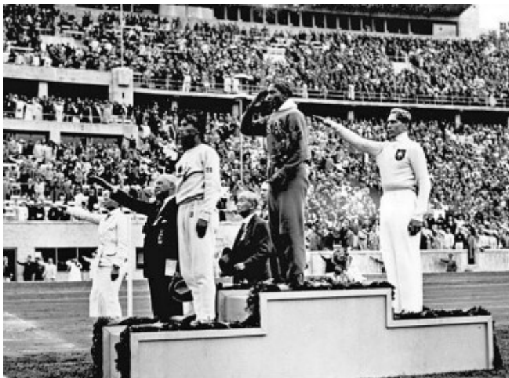
Slika 4. Jesse Owens (u sredini) tijekom dodijele medalja za skok u dalje na OI 1936. u Berlinu