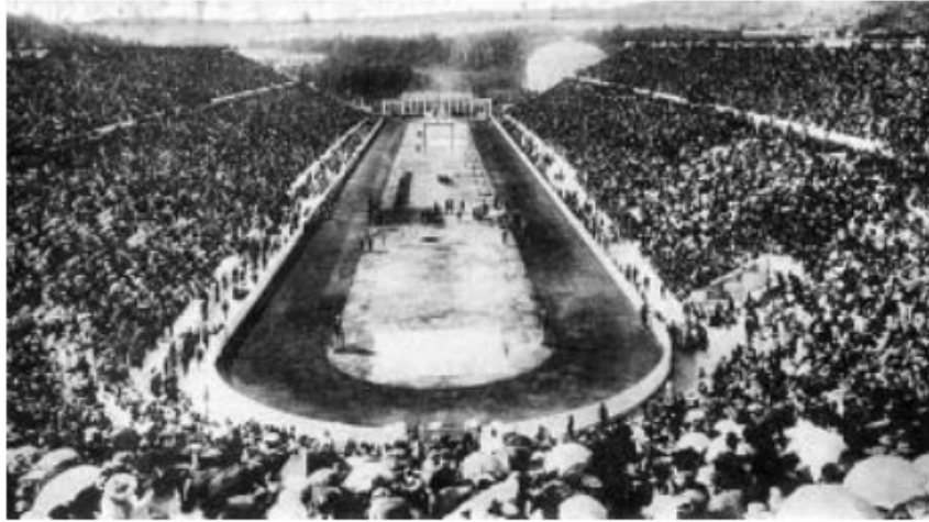
Figure 2.2. The Panathenian stadium, Athens during the 1896 Olympic Games.