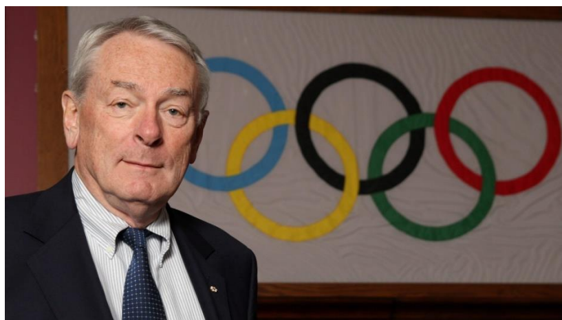
Slika 1, Dick Pound

U studenom 2015. Francuska započinje kriminalističku istragu protiv bivšeg predsjednika IAAF-a Lamine Diacka, tvrdeći da je 2011. godine primio mito od ARAF-a u iznosu od milijun eura kako bi prikrio pozitivne rezultate dopinga najmanje šest ruskih sportaša (Staff, 2015).