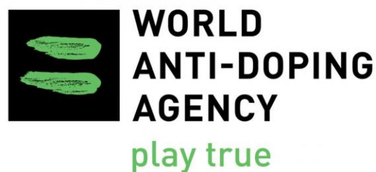
Slika 4, WADA logotip