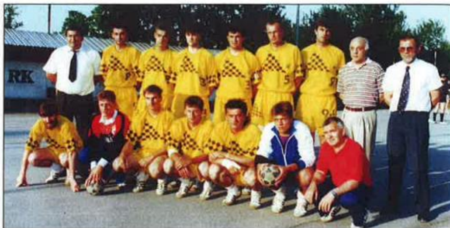
Slika 7. RK „Našice“ , seniori koji su osvojili 3. hrvatsku rukometnu ligu u sezoni 1994./95.