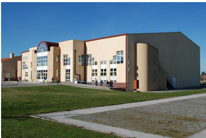
Slika 2. Dvorana Osnovne škole Kralja Tomislava Našice

Izvan klasičnih sportskih disciplina, Našice su također domaćin raznih sportskih događanja i manifestacija koje privlače pažnju šire publike punu entuzijazama i zajedništva. Našice ne samo da slave uspjehe svojih sportaša, već i podržavaju svakoga tko želi sudjelovati i dati sve od sebe. Sportski duh koji se proteže kroz Našice odražava se u svakodnevnom životu stanovnika, inspirirajući ih da se bave fizičkom aktivnošću, razvijaju svoje talente i grade trajne veze sa svojom zajednicom. Našice nije samo grad, već i sportsko središte koje pulsira energijom, strašću i željom za postizanjem viših ciljeva.