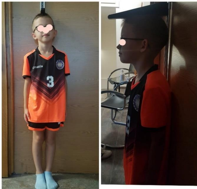
Slika 4. Mjerenje tjelesne visine igrača

Tjelesna težina (TT) nogometaša mjerena je pomoću digitalne vage (Slika 5). Vaga je postavljena na ravnu površinu na tlu. Ispitanik je u sportskoj opremi stao na vagu, bez obuće, te je nakon toga očitani rezultat. Mjerenje je provedeno jedan put za svakoga igrača, a rezultat je evidentiran u kilogramima (kg).