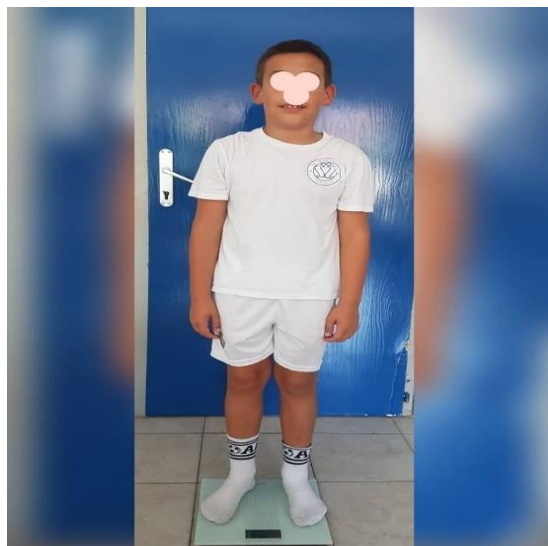
Slika 5. Mjerenje tjelesne težine igrača

Tjelesna težina (TT) nogometaša mjerena je pomoću digitalne vage (Slika 5). Vaga je postavljena na ravnu površinu na tlu. Ispitanik je u sportskoj opremi stao na vagu, bez obuće, te je nakon toga očitani rezultat. Mjerenje je provedeno jedan put za svakoga igrača, a rezultat je evidentiran u kilogramima (kg).