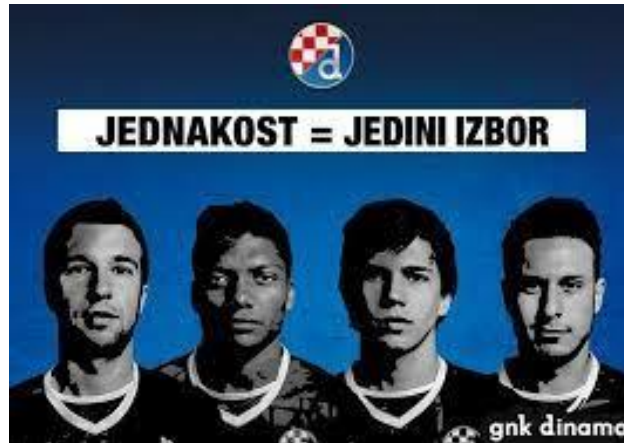
Slika 5.4. Kampanja GNK Dinama - „Jednakost=jedini izbor“.

Kako bi se istaknulo bogatstvo različitosti, igrači različitih boja kože, nacionalnosti i materinjih jezika su u sklopu kampanje „Jednakost=jedini izbor“ bili pozvani da preko videoporuka istaknu bogatstvo različitosti. To je sve dio klupskog „Projekta prevencije i sprječavanja nasilja, rasizma i drugih oblika netolerancije u nogometu” u GNK Dinamu koji traje od 2012. godine (Gnkdinamo.hr, 2015).