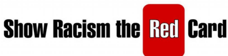
Slika 5.6. Kampanja „Pokažimo rasizmu crveni karton“.

Udruga „Nogometni sindikat“ je u sklopu FARE akcijskih tjedana napravila kratak video pod nazivom „Pokažimo rasizmu crveni karton“ za sve prvoligaške klubove i njegove članove kako bi dali svoj doprinos u borbi protiv rasizma i diskriminacije na stadionima (Huns.hr, 2014).