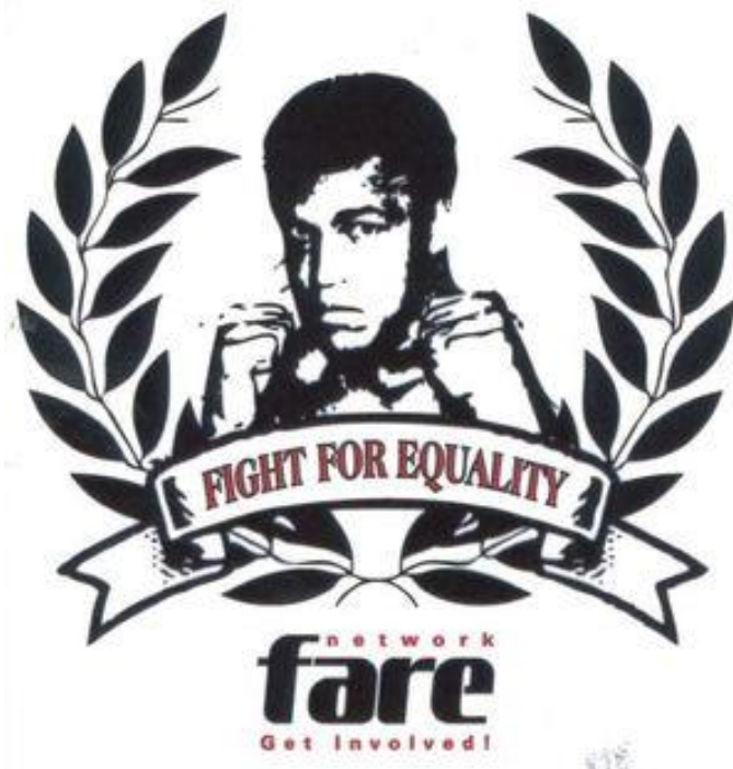
Slika 5.1. Simbol FARE mreže.