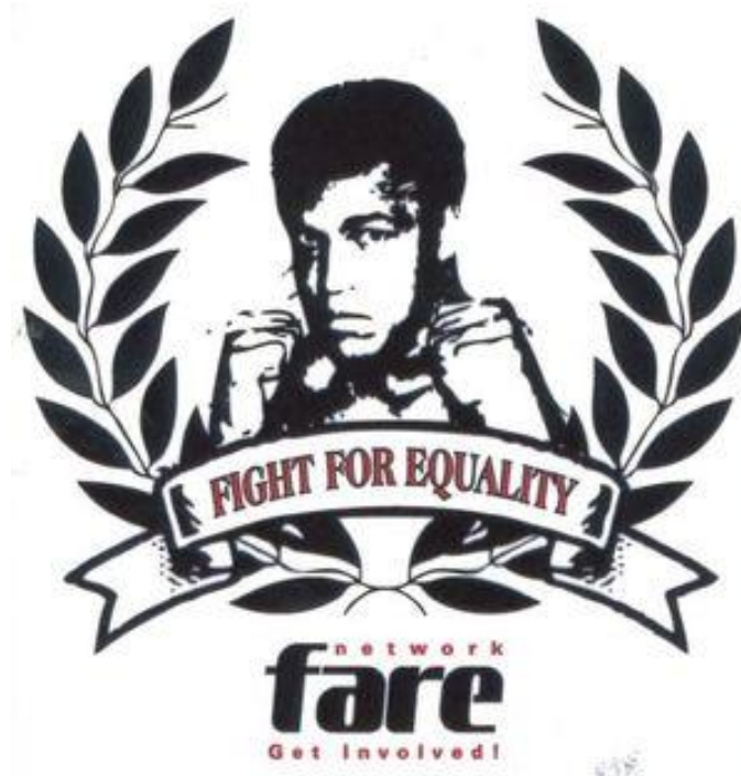
Slika 5.1. Simbol FARE mreže.