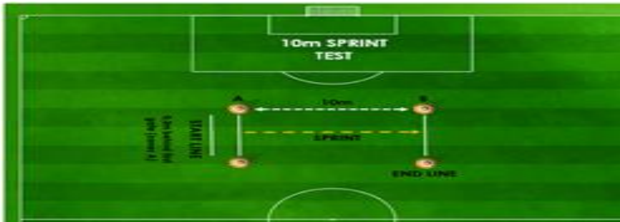
Slika 3. Test sprint na 10 metara

T-test je test agilnosti. Izvodi se na ravnoj i tvrdoj podlozi u dvorani. Na udaljenosti od 10 yarda (9,14m) od startne linije postavljen je čun, te su na udaljenosti od 5 yarda (4,57m) od tog čunja lijevo i desno postavljeni čunjevi. Ispitanik zauzima poziciju visokog starta i na znak mjeritelja počinje trčati. Kada dođe do čunja obavezno ga mora dotaknuti, a zatim ide lijevo bočnim kretanjem (dokorakom) do drugog čunja kojeg mora dotaknuti. Nakon toga ide desno bočnim kretanjem (dokorakom) do trećeg čunja kojeg također mora dotaknuti. Vraća se do prvog čunja bočnim kretanjem u lijevo i trči unatrag do startne linije. Zadatak se tri puta s pauzom, a kao meritorni rezultat se uzima najbolji rezultat. Svrha mjerenja je procjena čeone agilnosti i bočne agilnosti (Slika 4).