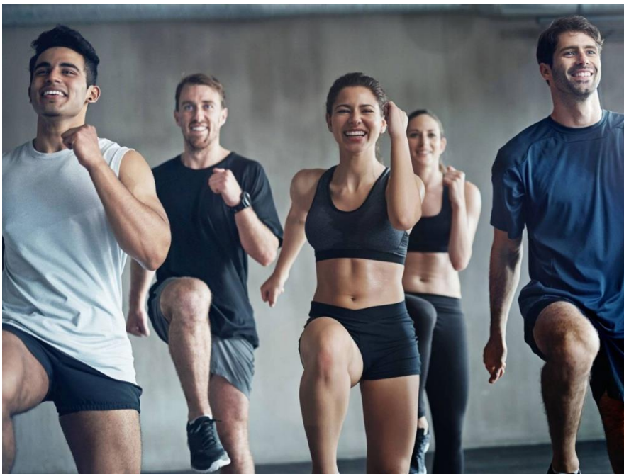
Slika 2. Fat burning

U ovu grupu spadaju: Workout programi, Body combat, Mix aerobik, Body attack, Boot camp, Fat burning i mnogi drugi (Ljubojević, Šebić 2017: 38-39).