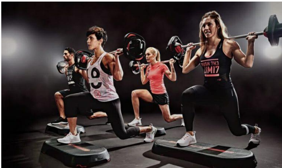
Slika 1. Body pump

Tone up, Body pump, New body, Group power, Aqua fitness, Core training samo su neki od naziva mišićnih programa kojih danas ima podosta (Ljubojević, Šebić 2017: 37-38).