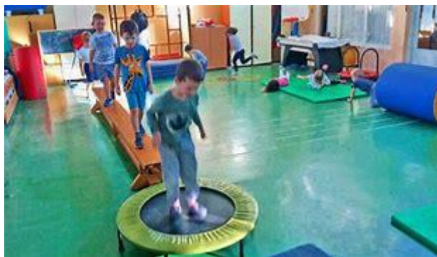
Slika 12. Kružni sat TZK za predškolsku dob

se ispod kozlića i dolazi do debelih strunjača na kojima radi palačinke. Zadnja stanica je mala greda koju prehoda uz pomoć svog odgajatelja i ponovno kreće cijeli krug ispočetka (ponoviti tri puta). Nakon završetka zadnjeg kruga djeca sa svojim odgajateljima odrađuju završni dio sata uz vježbe opuštanja (Gimnastika za djecu, 2021) 11 .