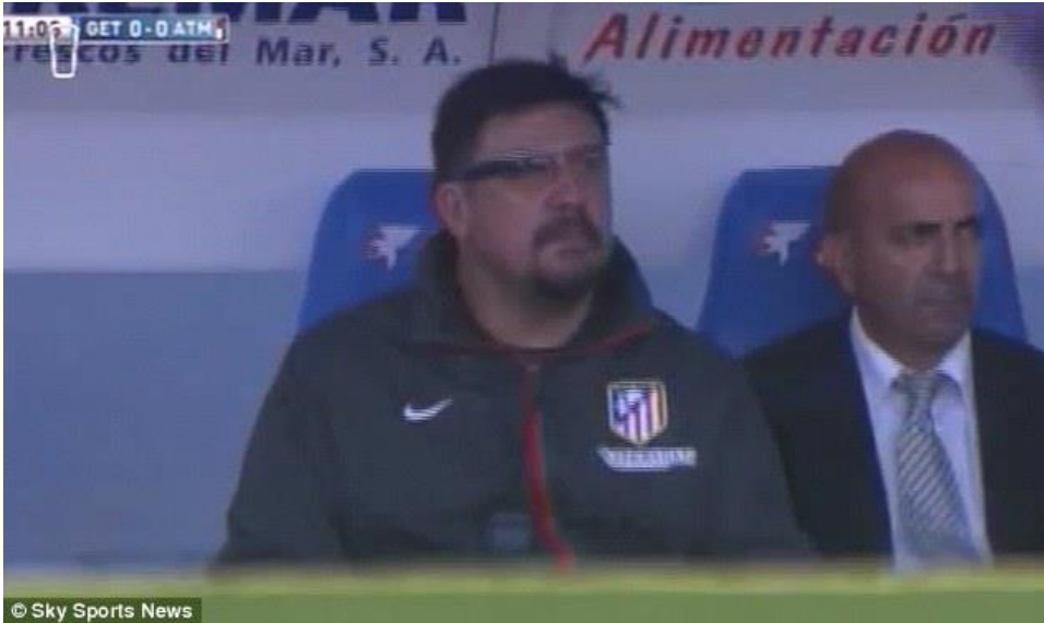
Slika 1. Pomoćni trener Atletico Madrida nosi Apple Glasses koji mu u realnom vremenu pruža statističke podatke o igri svoje ekipe.

U današnjem modernom svijetu kreirani su mnogi računalni programi koji se koriste za notacijsku analizu utakmica (Dartfish, CourtEye) koje pružaju mogućnost analiziranja same utakmice u realnom vremenu ili pomoću videa . Prethodno navedeni programi pružaju podatke o cijeloj ekipi ili jednom igraču korištenjem većeg broja varijabli u većem (ili manjem) broju natjecateljskih ili prijateljskih utakmica . Poželjno je da broj promatranih utakmica bude što veći radi mogućih odstupanja u promatranju i bilježenju podataka kao i odstupanju u kvaliteti izvedbe nogometaša. Dobiveni podaci se promatraju te ih trener koristi u svojim treninzima, sve sa svrhom unaprjeđenja TE-TA znanja nogometaša i upoznavanja nogometaša sa zahtjevima trenera u svim fazama igre.