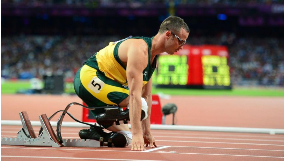
Slika 5.1. Južnoafrički atletičar Oscar Pistorius (Lindstrom, 2020).