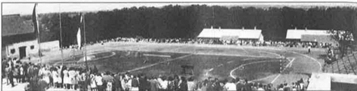
Slika 4. Prvo rukometno igralište u Našicama

S obzirom da u početku nije bilo dovoljno prostora za rukometno igralište normalnih dimenzija, u jesen 1960. godine krenulo se u osposobljavanje manjeg prostora samo za izvođenje nastave tjelesnog vježbanja. Nakon dvije godine otkupljeno je i nešto zemljišta pa je tako bilo dovoljno prostora za rukometno igralište normalnih dimenzija, te prostor za igralište. Rukometaši do sredine jesenskog dijela natjecateljske 1961./62. godine, dovršavaju igralište, jer su sve do njegovog dovršenja trenirali i odigrali utakmice na srednjoškolskom igralištu u parku. Igralište se dugi niz godina dograđivalo pa je tako stavljena mreža, rasvjeta i asfalt te je bilo jedno od boljih igrališta u tom dijelu Slavonije (Slika 4). (Čalić, 2013.)