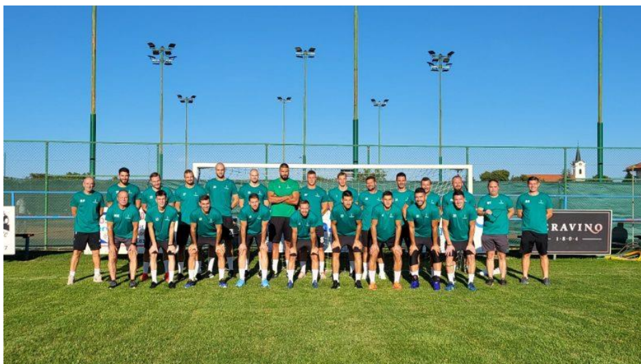
Slika 10. RK NEXE na početku priprema za sezonu 2023./24.

Klub je kroz povijest osvojio velik broj trofeja na lokalnoj razini kao najbolji klub grada Našica i najbolji sportski kolektiv Osječko-baranjske županije. (Čalić, 2013.) Značajniji uspjesi na državnoj i europskoj razini počinju od sezone 2008./09. RK NEXE je do sada sveukupno bio doprvak Hrvatske 14. puta te je to njegov najveći uspjeh. U hrvatskom kupu su također višestruki doprvaci države. Također, od sezone 2008./2009., RK NEXE je postao redoviti sudionik europskih natjecanja u rukometu. Klub je stekao pravo sudjelovanja u tim natjecanjima zbog svojih rezultata i igračke kvalitete, što je omogućilo igračima i navijačima da dožive natjecanje na međunarodnoj razini. Najbolji rezultat je bio u sezoni 2021./22. kada su se plasirali na Final Four Europske rukometne lige. Taj rezultat ujedno označava i jedan od najboljih rezultata hrvatskog klupskog rukometa. Uspjeh i kvaliteta idu uzlaznom putanjom te će sigurno u slijedećim godinama doći i do prvih trofeja. ( https://www.rknexe.hr/ )