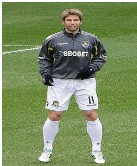
Slika 7. Thomas Hitzlsperger