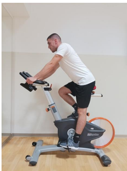
Slika 4. Prikaz pokreta „Seated climb“

- Seated climb: za ovaj pokret je potrebno veće opterećenje i sporiji tempo koji se kreće od 60 do 80 okretaja u minuti.