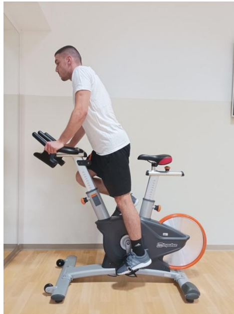
Slika 5. Prikaz pokreta „Standing climb“

Tijekom spinning treninga mogu se raditi i ostale varijacije pokreta, poput sklekova koji se izvode na isti način kao i „jumps“. Mogu se raditi tako da su ruke postavljene na vanjskim drškama pa tako simuliraju široke sklekove te isto tako na središnjim drškama koji simuliraju uske sklekove. Isto tako mogu se raditi izdržaji u položaju skleka od 10 do 20 sekundi. Također penjanje se može izvoditi na način da se podlaktice stave na drške, a leđa se drže ravno. Sprint je isto jedan od pokreta kojeg karakterizira što brži tempo od 10 do 30 sekundi.