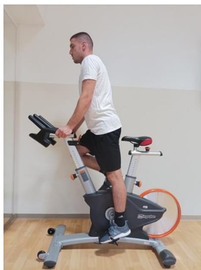
Slika 2. Prikaz pokreta „Standing flat“

- Standing flat (poznato kao i trčanje): ovaj pokret karakterizira uspravno držanje dok stojimo, što podsjeća na trčanje. Tempo u ovom pokretu je od 80 do 110 okretaja u minuti.