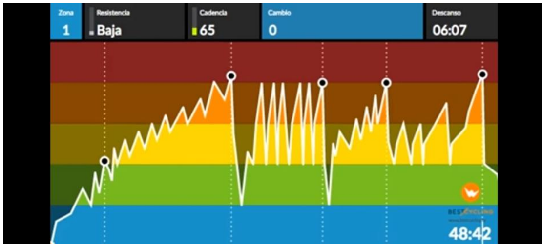
Slika 9. Prikaz provedenog treninga