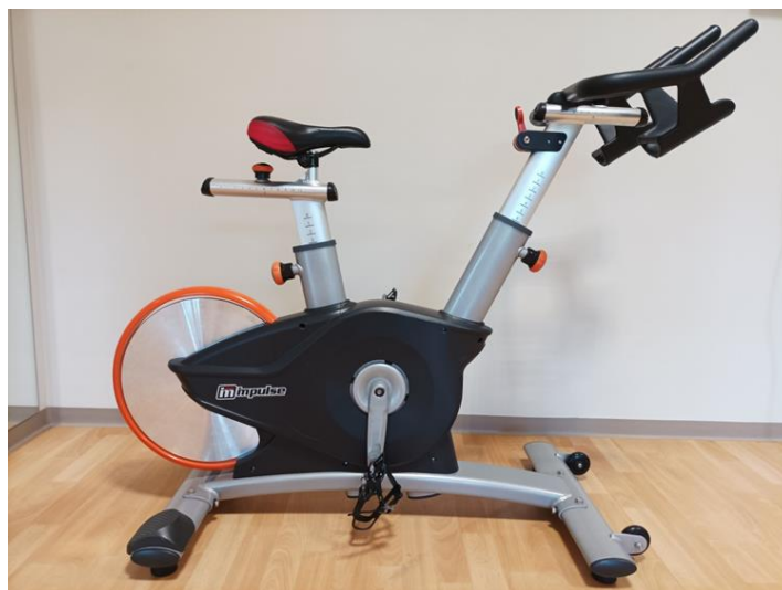
Slika 7. prikaz spinning bicikla

Rezultati tijekom spinning treninga dobiveni su pomoću Polar team sistema. Ispitanici su nosili na sebi pojas za mjerenje srčanih otkucaja tijekom cijelog treninga. Pojas mjeri vrijeme provedeno u zonama tijekom treninga i otkucaje srca u minuti tijekom cijelog treninga. Senzori unutar pojasa povezani su sa monitoringom te omogućavaju ispis podataka. Rezultati su se očitovali na tabletu tijekom treninga. U svakom trenutku treninga podaci su se mogli pratiti na tabletu iz sekunde u sekundu. Isti ti rezultati unešeni su u excel tablice.