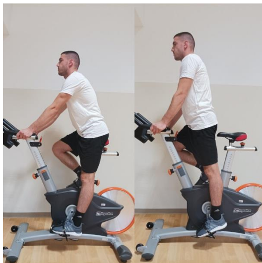
Slika 3. Prikaz pokreta „Jumps“

- Seated climb: za ovaj pokret je potrebno veće opterećenje i sporiji tempo koji se kreće od 60 do 80 okretaja u minuti.