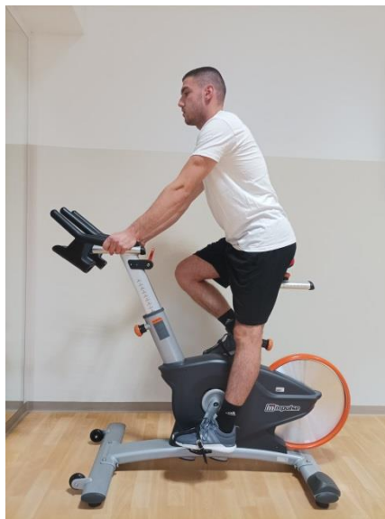
Slika 1. Prikaz pokreta „Seated flat“

- Standing flat (poznato kao i trčanje): ovaj pokret karakterizira uspravno držanje dok stojimo, što podsjeća na trčanje. Tempo u ovom pokretu je od 80 do 110 okretaja u minuti.