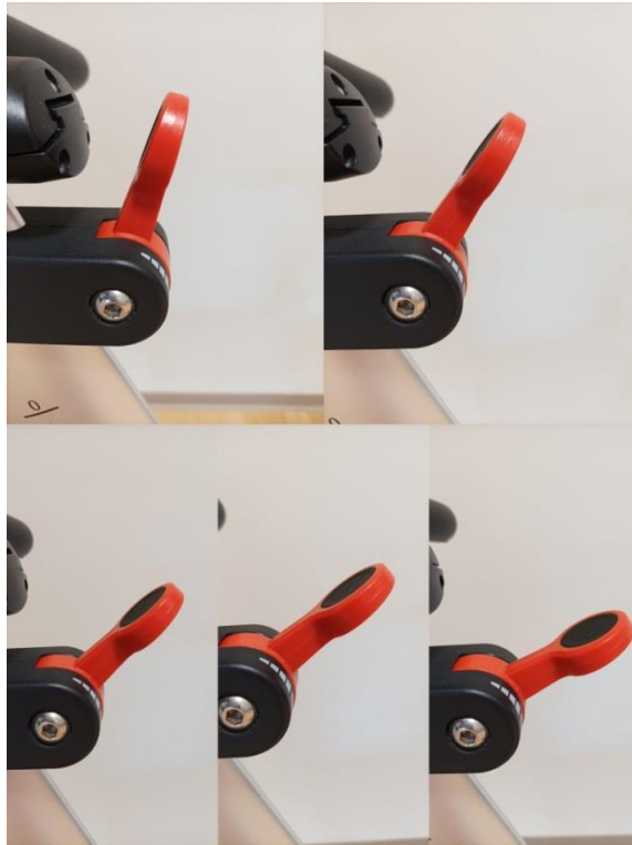
Slika 6. Prikaz ručice za povećanje opterećenja na spinning biciklu