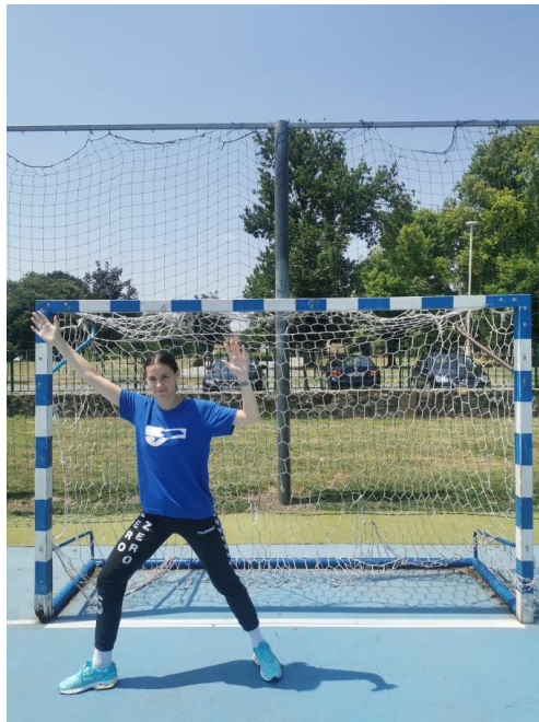
Slika 2. Obrana visokog udarca

Obrana visokih udaraca započinje iz osnovnog stava. U osnovnom vratarskog stavu težina je ravnopravno raspoređena na obje noge koje su razmaknute za širinu ramena (Rogulj, 2000). Koljena su u ovom stavu blago pogrčena, a ruke su također pogrčene u laktovima za nešto više od 90° (slika 2.). Obrana započinje tako da se vratar jednom nogom odgurne od tla ili odrazi suprotnom nogom u odnosu na stranu u koju je upućena lopta. Na udarac se može ići istovremeno objema rukama, ili samo jednom rukom u slučaju da je snaga udarca ili blizina udarca jako velika.