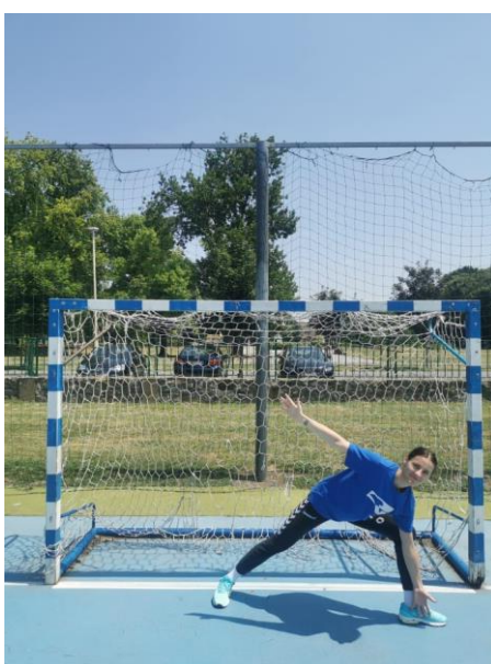
Slika 4. Obrana niskog udarca

Iz osnovnog stava vrši se otklon suprotnom nogom u odnosu na loptu, koji je usmjeren pod što manjim uglom. Noga bliža lopti istovremeno vrši bočni iskorak tako da se težina u potpunosti prenosi na iskoračnu nogu. Trup se otklanja prema mjestu kontakta s loptom uz istovremeno okretanje oko uzdužne osovine prema naprijed. Bliža ruka se ispruža i postavlja ispred iskoračne noge gotovo do tla, dok je slobodna ruka ispružena i nalazi se s druge strane trupa radi održavanja ravnoteže (Slika 4.) (Rogulj, 2000).