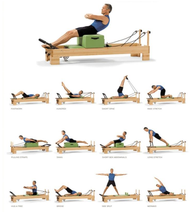
Slika 1 Vježbe na pilates reformeru