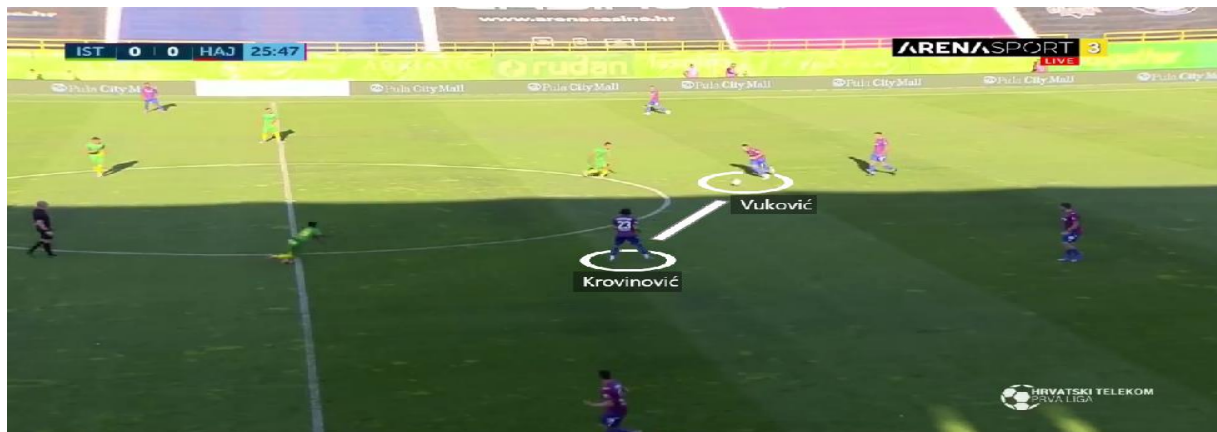
Slika 4. Početak izgradnje napada preko dvojice veznih igrača

Duge lopte od središnjih braniča te veznih prema napadačima bile su najčešći pokušaji dolaska do protivničkog gola. Kad bi se osvojio prostor u sredini terena, dodavanja bi najčešće išla prema krilnim igračima, Sahitiju i Eduoku koji su driblinzima pokušavali stvoriti višak te uputiti udarac prema голу ili proigrati napadače (Slika 5).