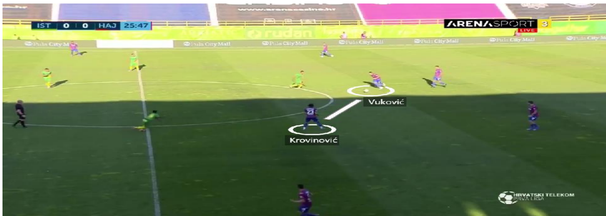
Slika 4. Početak izgradnje napada preko dvojice veznih igrača

Duge lopte od središnjih braniča te veznih prema napadačima bile su najčešći pokušaji dolaska do protivničkog gola. Kad bi se osvojio prostor u sredini terena, dodavanja bi najčešće išla prema krilnim igračima, Sahitiju i Eduoku koji su driblinzima pokušavali stvoriti višak te uputiti udarac prema голу ili proigrati napadače (Slika 5).