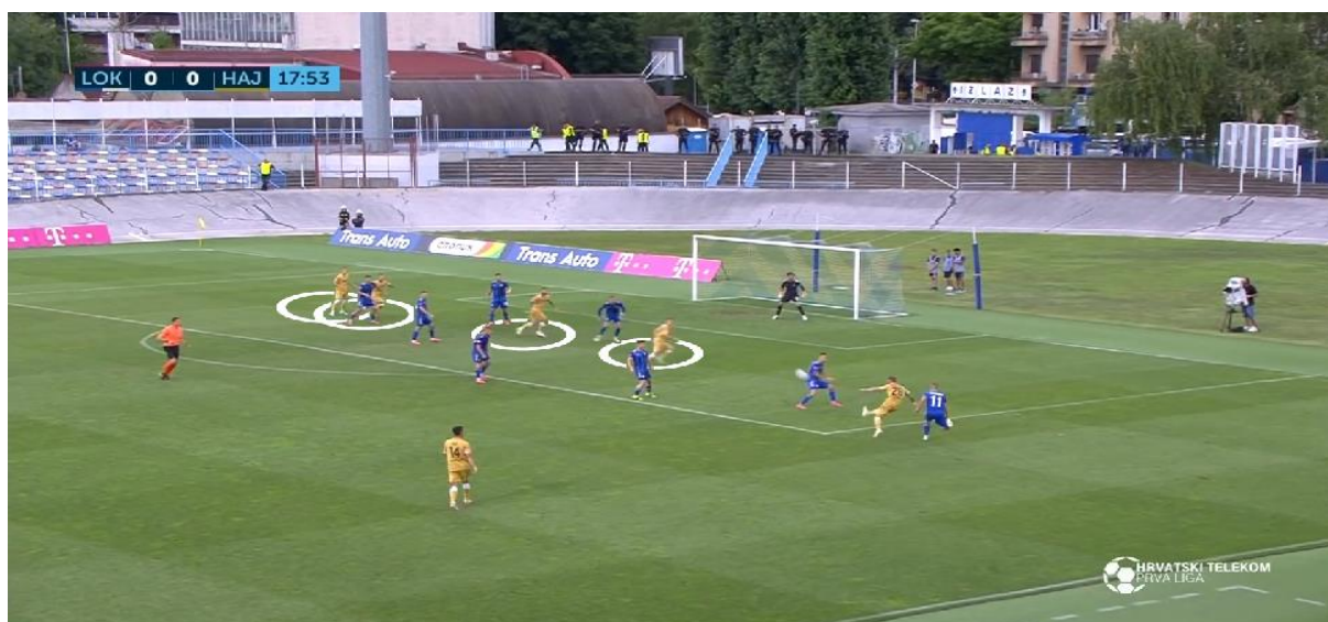
Slika 7. Završnica akcije ubačajem u kazneni prostor

Valdas Dambrauskas vodio je 30.11.2021. HNK Hajduk protiv NK Lokomotive u utakmici četvrtfinala Supersport hrvatskog nogometnog kupa. HNK Hajduk je ostvario pobjedu rezultatom 3:6 te se plasirao u daljnu fazu natjecanja. Golove za goste postigli su Filip Krovinović, Marin Ljubičić, Marko Livaja, Emir Sahiti te dvostruki strijelac Jani Atanasov. Za domaćina su precizni bili Josip Pivarić i Marko Dabro te autogol Josipa Eleza. Gostujuća momčad imala je znatno veći broj udaraca prema protivničkom голу (Tablica 10).