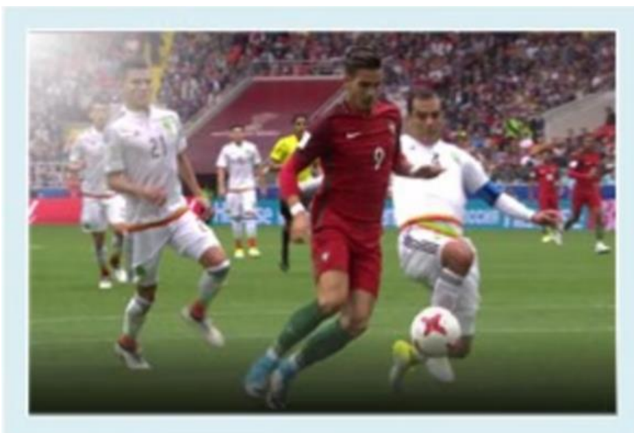
Slika 3. AVAR3

AVAR3 (Slika 3.) se usredotočuje na TV programe, pomaže VAR-u u procjeni incidenata i osigurava dobru komunikaciju između VAR-a i AVAR-a 2 koji se nalazi na stanici zaleđa.