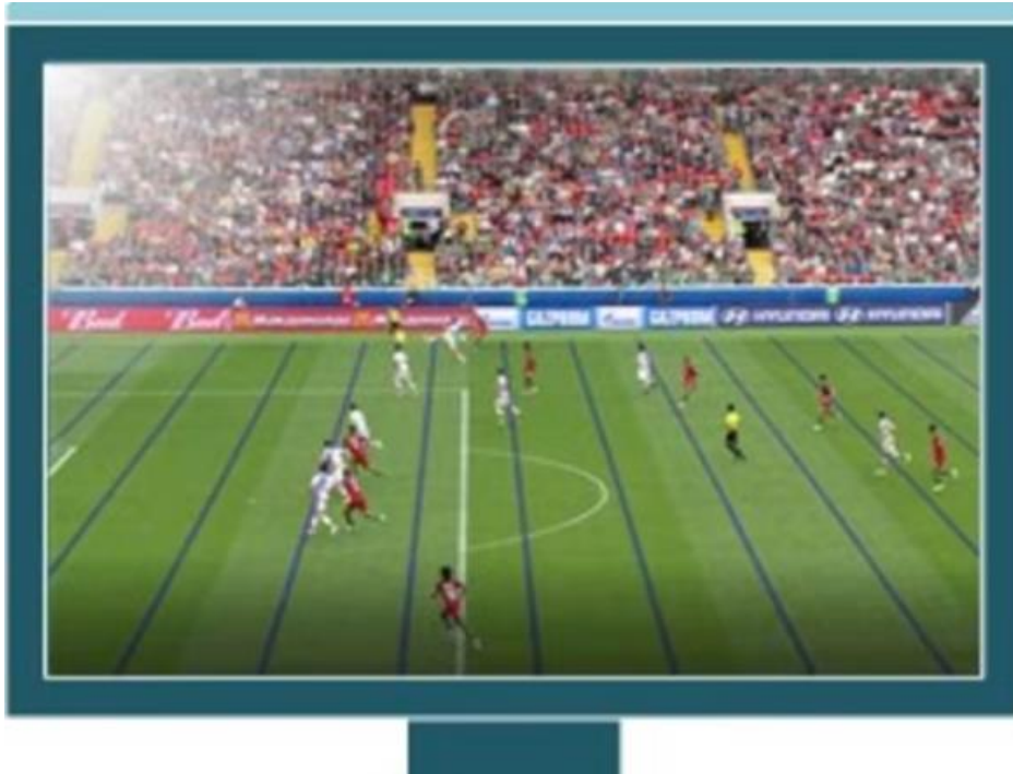
Slika 3. AVAR2