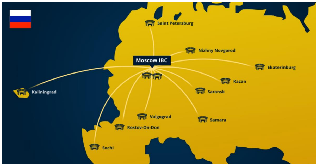
Slika 4. Međunarodni centar za emitiranje