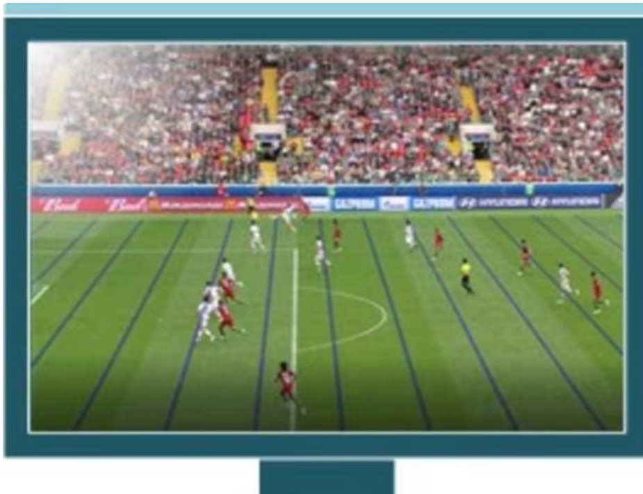
Slika 3. AVAR2

Izvor: https://www.fifa.com/technical/football-technology/standards/video-assistant-referee/var-at-the-2018-fifa-world-cup